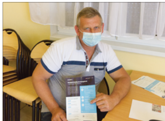
Z broszurami na temat szczepień można zapoznać się w Biurze Obsługi Klienta UM Żarów oraz w każdej innej jednostce organizacyjnej na terenie gminy Żarów.

o ograniczonej mobilności i czynna jest od poniedziałku do piątku w godz. 8.00 – 15.00. Seniorzy, którzy nie mogą dojechać do punktu szczepień we własnym zakresie mają możliwość korzystania z nieodpłatnej pomocy strażaków z jednostek OSP funkcjonujących na terenie gminy Żarów. Akcja prowadzona jest we współpracy z Urzędem Miejskim w Żarowie. Na terenie gminy Żarów punkt szczepień zorganizowany jest w Niepublicznym Zakładzie Opieki Zdrowotnej „Medicus”