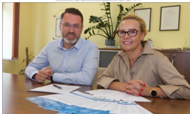
Dzięki podpisanemu porozumieniu z Dolnośląskim Centrum Onkologii we Wrocławiu mieszkańcy będą mogli skorzystać z bezpłatnych badań przesiewowych wykrywających raka jelita grubego. więcej na stronie 3.