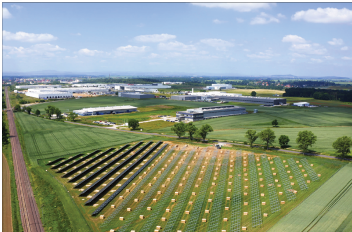
Farma fotowoltaiczna w Żarowie ma być gotowa pod koniec sierpnia 2021 roku. więcej na stronie 4.