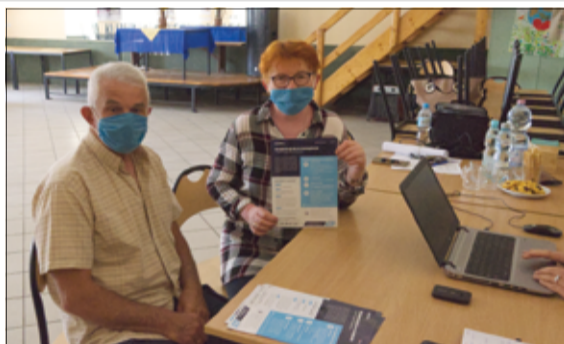
Na zorganizowanych mobilnych punktach Narodowego Spisu Powszechnego na terenach wiejskich do mieszkańców trafiła kolejna porcja ulotek na temat szczepień.

Dane statystyczne szczepień przeciw COVID-19 na poziomie gmin można śledzić w serwisie https://www.gov.pl/web/szczepienia-gmin . W gminie Żarów na dzień 22 czerwca w pełni zaszczepionych jest 2.822 mieszkańców, przynajmniej jedną dawką zaszczepiło się 4.648 mieszkańców, co stanowi 22,9%. Zaszczepiono 148 osób w wieku 12-19 lat. Szczepionki na koronawirusa są dobrowolne i bezpłatne. Przypominamy, że dla mieszkańców gminy Żarów, mających trudności w samodzielnym dotarciu do punktu szczepień w Żarowie, został uruchomiony telefon kontaktowy do koordynatora – 603 740 464 i 74 30 67 367 pod którym można zgłaszać prośbę o zapewnienie transportu do punktów szczepień. Infolinia dedykowana jest seniorom i osobom niepełnosprawnym