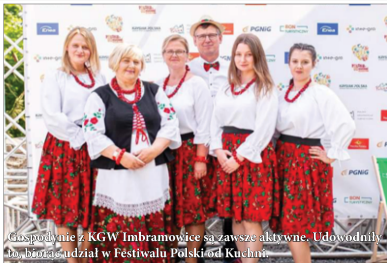
Gospodynie z KGW Imbramowice są zawsze aktywne. Udowodniły to, biorąc udział w Festiwalu Polska od Kuchni.

Koło Gospodyń Wiejskich w Imbramowicach to grupa aktywnie działających kobiet. Panie organizują mnóstwo spotkań, warsz-