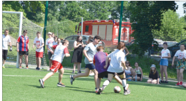
Piłkarski turniej Brzechwa Cup na stadionie sportowym w Żarowie.

Dużo emocji, ale przede wszystkim radości wywołał turniej piłkarski Brzechwa Cup, który w piątek, 18 czerwca zorganizowali: Szkoła Podstawowa im. Jana Brzechwy w Żarowie wraz z Radą Rodziców.