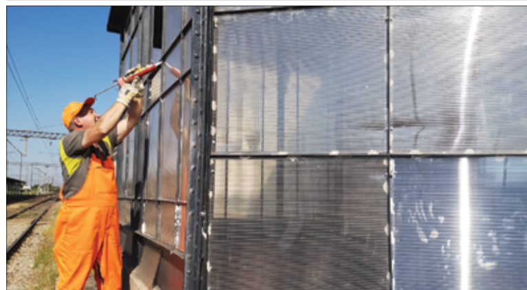
Trwa wymiana zniszczonych szyb w przejściu podziemnym.

Zgodnie z zapowiedziami, PKP PLK S.A. rozpoczęło prace remontowe przejścia podziemnego przy dworcu PKP w Żarowie.