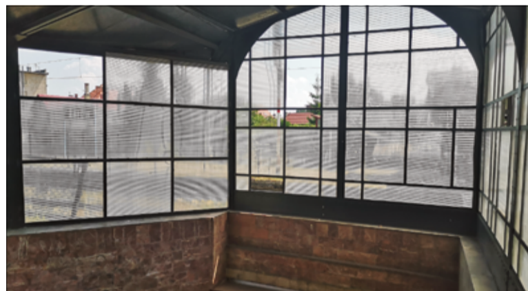
Kolejne prace, według zapewnień, będą sukcesywnie realizowane.