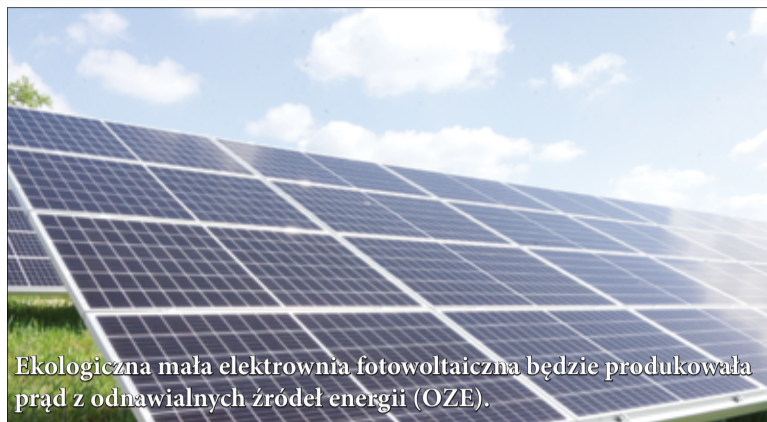
Ekologiczna mała elektrownia fotowoltaiczna będzie produkowała prąd z odnawialnych źródeł energii (OZE).

Budowa elektrowni fotowoltaicznej to pierwsze takie przed-