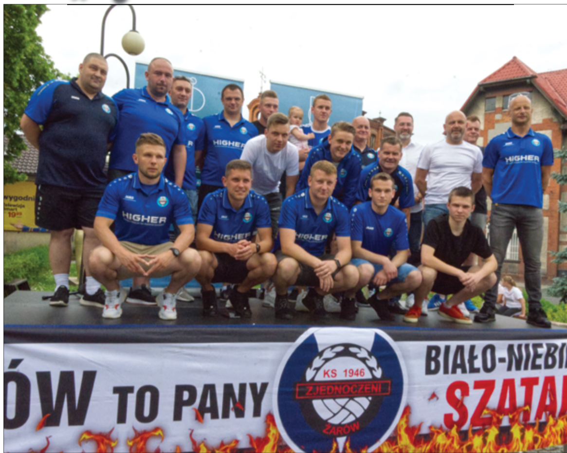
W tym roku klub Zjednoczeni Żarów obchodzi jubileusz 75-lecia swojego funkcjonowania. więcej na stronie 7.