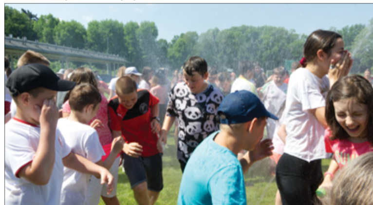
W taki upalny dzień trochę ochłody nie zaszkodziło. Uczniowie chętnie korzystali z kurtyny wodnej przygotowanej przez OSP Żarów.