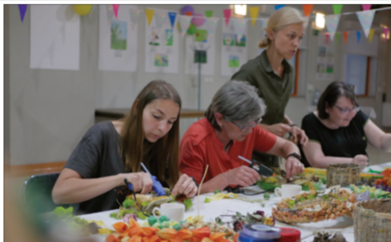
Uczestniczki warsztatów stworzyły wspaniałe i niepowtarzalne dekoracje.

– Zapraszamy wszystkie Panie na nasze wspólne zajęcia. Cieszymy się, że możemy znów gościć naszych mieszkańców w murach Gminnego Centrum Kultury i Sportu w Żarowie. Zajęcia rozpoczęliśmy od warsztatów „Cuda Wianki”, na których tworzymy piękne dekoracje. Przed nami kolejne warsztaty z cyklu „Żarów na obcasach”. Obserwujecie naszą stronę inter-