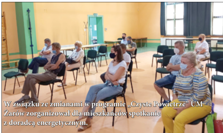
W związku ze zmianami w programie „Czyste Powietrze” UM Żarów zorganizował dla mieszkańców spotkanie z doradcą energetycznym.

łałności punktu mieszkańcy będą mogli m.in. skorzystać z pomocy pracowników w przygotowaniu wniosku, a także złożyć podpisany wniosek w kancelarii gminy (data złożenia wniosku w kancelarii gminy stanowi datę złożenia wniosku do WFOŚiGW w rozumieniu Programu).