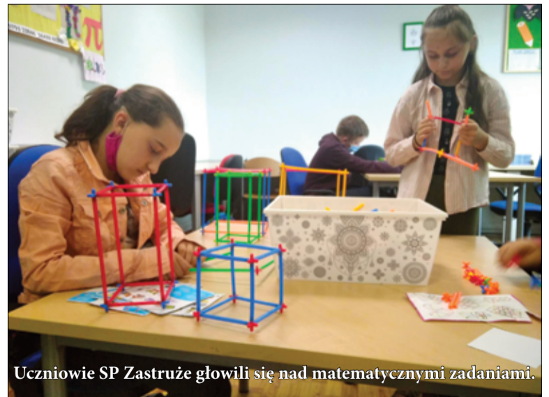
Uczniowie SP Zastruże głowili się nad matematycznymi zadaniami.

nudna”. Zwłaszcza, jeśli zaprzyjaźnimy się z nią od dziecka”. Dlatego w ramach projektu odbyły się m.in. Rodzinne Podchody Matematyczne, cykliczne