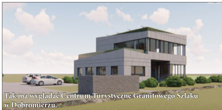
Tak ma wyglądać Centrum Turystyczne Granitowego Szlaku w Dobromierzu.

Centrum Turystyczne Granitowego Szlaku ma powstać w Dobromierzu w połowie 2022 roku. Będzie to obiekt, który pomieści muzeum granitu oraz będzie przestrzenią do promocji produktów lokalnych. W Centrum odbywać się będą warsztaty, szkolenia oraz spotkania dla mieszkańców regionu i turystów. Przyszłe działania Centrum: promocyjne, edukacyjne, szko-