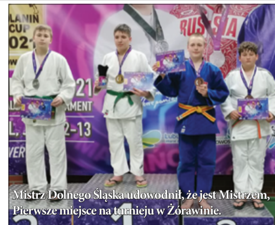
Mistrz Dolnego Śląska udowodnił, że jest Mistrzem. Pierwsze miejsce na turnieju w Żórawinie.

zawodnik wrocławskiego klubu sportowego MaKo Judo, zakończył sezon z bardzo dobrymi wynikami. – Na turnieju w Nowej Soli