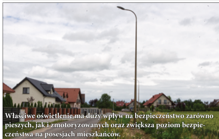
Właściwe oświetlenie ma duży wpływ na bezpieczeństwo zarówno pieszych, jak i zmotoryzowanych oraz zwiększa poziom bezpieczeństwa na posesjach mieszkańców.

Zakończył się montaż nowych słupów oświetleniowych w Kalnie oraz przy ul. Henryka Pobożnego w Żarowie.