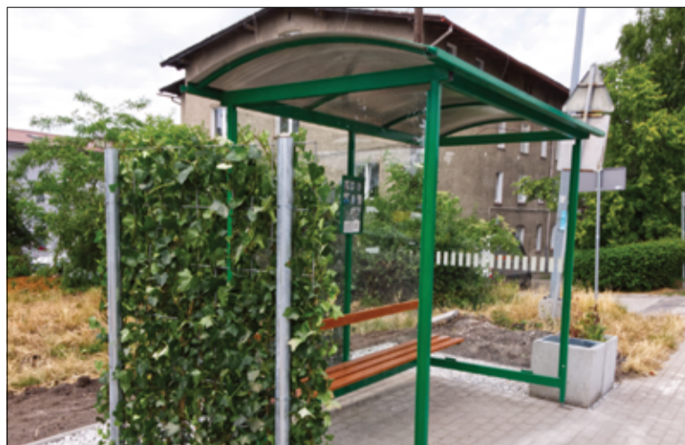
Mieszkańcy mogą korzystać z kolejnego zielonego przystanku. Na terenie miasta jest już kilka tak przystrojonych wiat.