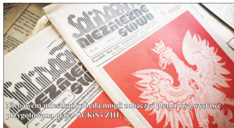
Niebawem mieszkańcy będą mogli zobaczyć plenerową wystawę przygotowaną przez GCKiS i ŻIH.