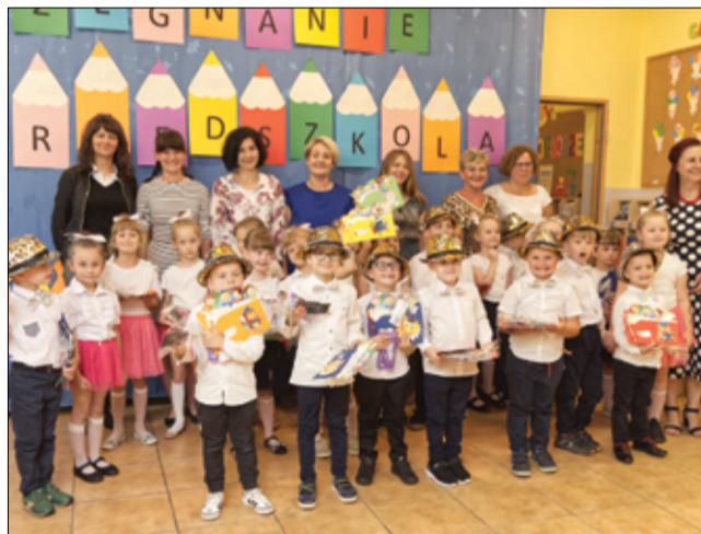
Pożegnanie absolwentów Bajkowego Przedszkola w Żarowie.

Wszystkim absolwentom Bajkowego Przedszkola serdecznie gratulujemy i życzymy słonecznych wakacji oraz pomyślności na dalszych szczeblach edukacji.