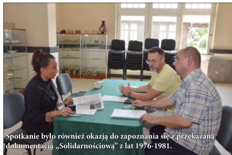
Spotkanie było również okazją do zapoznania się z przekazaną dokumentacją „Solidarnościową” z lat 1976-1981.

– Jestem przekonany, że współpraca Żarowskiej Izby Historycznej z Instytutem Pamięci Narodowej we Wrocławiu będzie owocna i pełna ciekawych projektów. Zależy nam na upowszechnianiu wiedzy na temat naszej lokalnej historii. Bardzo się cieszę, że będziemy