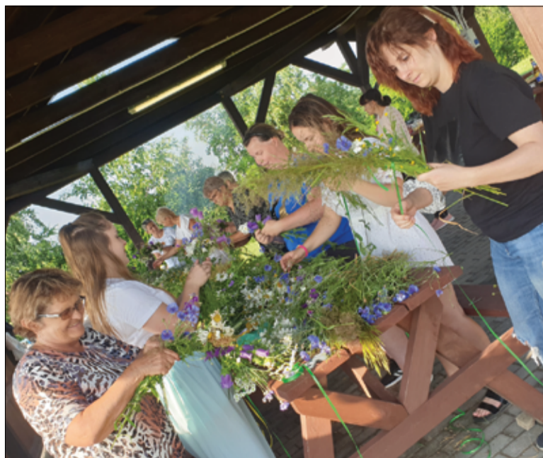
Panie z KGW Kalno na warsztatach wicia wianków.