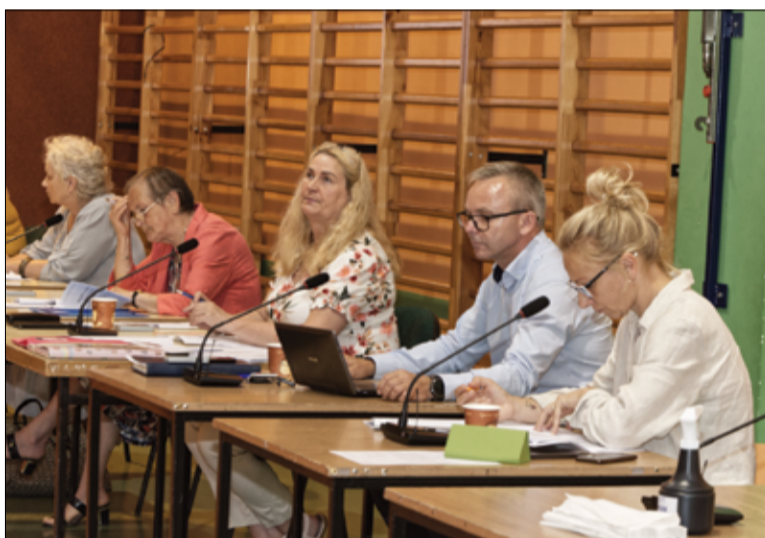
Za udzieleniem burmistrzowi absolutorium głosowali wszyscy obecni na posiedzeniu radni.

w tym dochody bieżące zrealizowano w ponad 98 % planu rocznego, a dochody majątkowe w ponad 118 %. Dochody własne z podatków i opłat lokalnych wykonano w kwocie blisko 18.469.000 zł, co stanowi 97,4 % wykonania planu rocznego. Wydatki budżetowe z kolei zamknęły się kwotą ponad 68.769.000 zł i zostały wykonane w ponad 96 %. W tym wydatki bieżące zrealizowano w blisko 97 %, a wydatki majątkowe w ponad 96 %. Na inwestycje wydatkowano w roku 2020 około 11.048.000 zł. Źródłem finansowania wydatków inwestycyjnych oprócz pożyczki z Narodowego Funduszu Ochrony Środowiska i Gospodarki Wodnej zaciągniętej między innymi na budowę kanalizacji sanitarnej, były również środki zewnętrzne (w szczególności unijne), które Gmina otrzymała w roku 2020 w kwocie łącznej ponad 6.750.000 zł. Ponadto Gmina na dzień 31 grudnia 2020r. nie posiadała zobowiązań wymagalnych, jak również nie posiadała zaległości z tytułu zaciągniętych pożyczek i wyemitowanych obligacji komunalnych. Na dzień 31.12.2020 r. Gmina spełniała wskaźniki