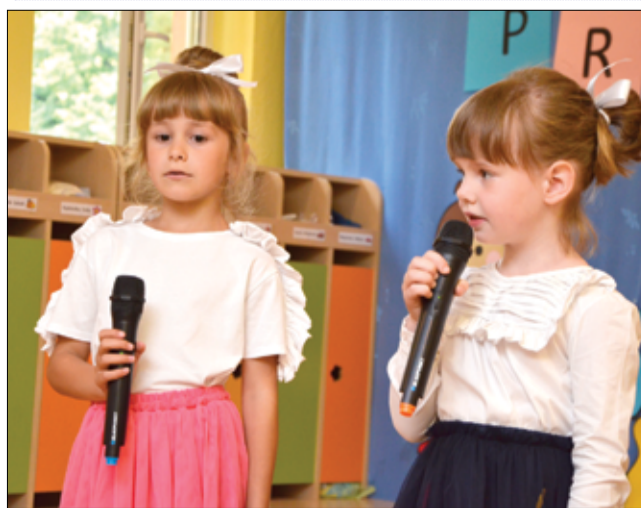
Występ przedszkolaków towarzyszyły ogromne brawa.