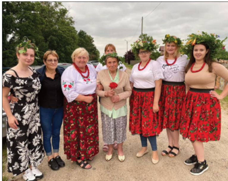
KGW Imbramowice podczas Nocy Świętojańskiej.

– W tym roku w mniejszym gronie, ale liczymy, że w kolejnych latach będą to obchody w większej piknikowej formie i z udziałem naszych mieszkańców, innych miejscowości oraz kół – czytamy na FB Sołectwo Imbramowice.