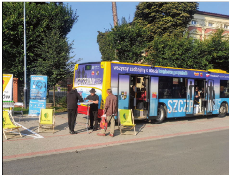
Gmina Żarów osiągnęła najwyższy wskaźnik wzrostu wyszczepienia w całym powiecie świdnickim.

Jako zwycięzcy otrzymamy 1 mln zł. Nagrodę można przeznaczyć na dowolny cel związany z przeciwdziałaniem COVID-19: zwalczaniem zakażenia, zapobieganiem rozprzestrzeniania się, profilaktykę oraz zwalczanie skutków COVID-19. Organizatorem Konkursu jest Pełnomocnik Rządu do spraw Narodowego Programu Szczepień Ochronnych Przeciwko Wirusowi SARS-CoV-2. Nagrody w Konkursie są finansowane ze środków Funduszu Przeciwdziałania COVID-19.