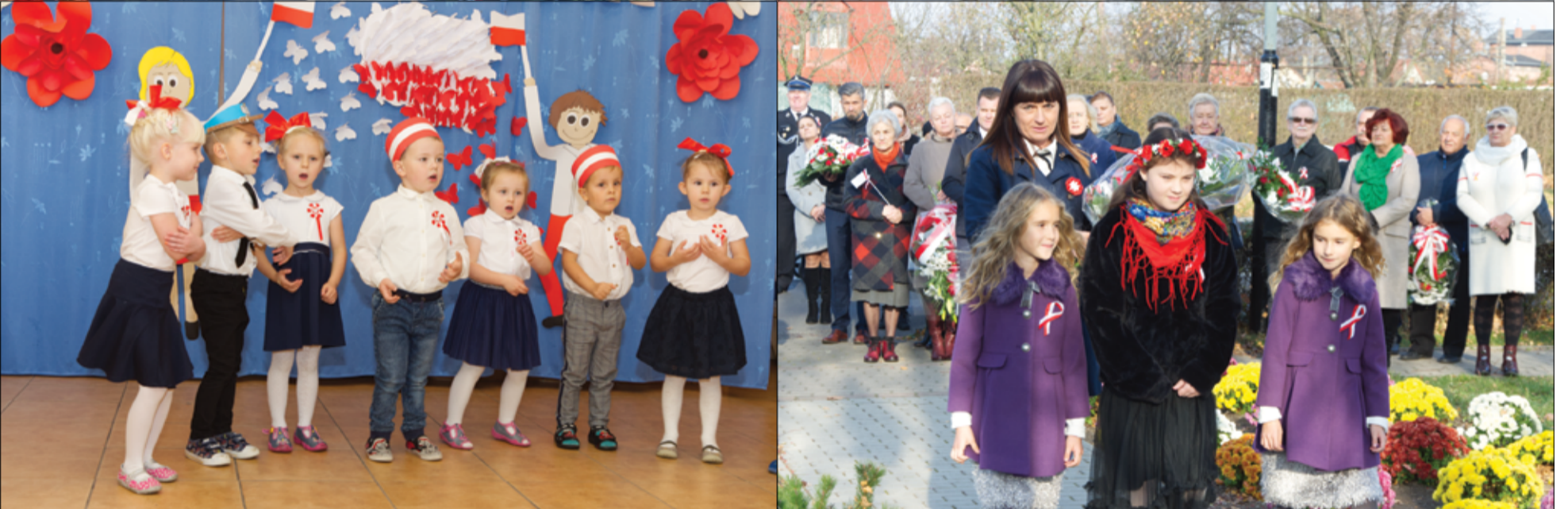
W 103. rocznicę odzyskania przez Polskę Niepodległości, pełni zadumy i bolesnego skupienia, uczciliśmy pamięć poległych, pomordowanych i zaginionych. Relacja na stronie 4.