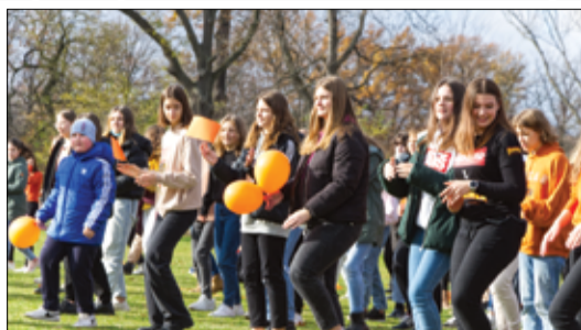
Jako wyraz naszego sprzeciwu, wspólnie zatańczyliśmy do utworu Jerusalema. W ten sposób pokazaliśmy, że świat jest piękny, jak nie ma w nim przemocy wobec drugiego człowieka.

Symbolem kampanii jest pomarańczowa wstążka. To znak ostrzegawczy mający zwrócić naszą uwagę na krzywdę drugiego człowieka. W cichym przemarszu wokół płyty boiska zgromadzeni, ubrani w pomarańczowe barwy z transparentami głoszącymi hasła kampanijne, wyrażaliśmy swój sprzeciw wobec przemocy kierowanej do dzieci i młodzieży. Zwieńczeniem przedsięwzięcia był wspólny taniec do utworu Jerusalema. Cała akcja cieszyła się wielkim zainteresowaniem ze strony lokalnej społeczności. Świadczyła o tym wspaniała atmosfera i licznie przybyli goście.