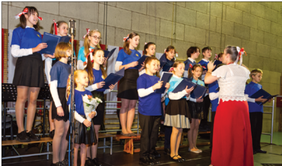
Laureaci Festiwalu: Chór Libro di Musica