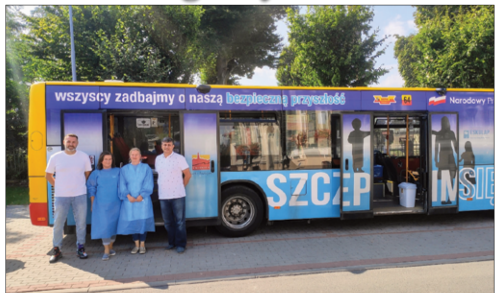
Dzięki działaniom promocyjnym gminy Żarów i naszym mieszkańcom zwyciężyliśmy w konkursie „Rosnąca Odporność”. Więcej informacji na stronie 3.