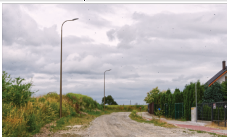
Prace przy budowie nowego oświetlenia potrwać do końca grudnia.

– Sukcesywnie krok po kroku, staramy się realizować kolejne wnioski składane przez mieszkańców naszej gminy. Budowa oświetlenia ma ogromny wpływ na poprawę bezpieczeństwa, dlatego każdego roku kontynuujemy prace związane z budową i modernizacją oświetlenia ulicznego. We wszystkich miejscowościach zamontowane zostaną oświetlenie uliczne z oprawami