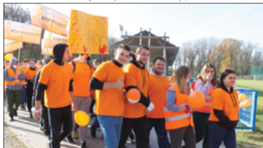
W akcji uczestniczyli uczniowie szkół i przedszkola, a także nauczyciele, pedagodzy, pracownicy UM i OPS Żarów oraz seniorzy.

Uczniowie wraz z nauczycielami i dyrektorami wszystkich placówek oświatowych funkcjonujących na terenie gminy Żarów, przedstawiciele Urzędu Miejskiego w Żarowie, pracownicy Ośrodka Pomocy Społecznej, seniorzy z żarowskiego Uniwersytetu Trzeciego Wieku wzięli udział w „Kampanii 19 dni przeciw przemocy i krzywdzeniu dzieci oraz młodzieży”, której inicjatorem była społeczność Zespołu Szkół im. Jędrzeja Śniadeckiego w Żarowie. We wtorek, 9 listopada spotkaliśmy się wszyscy na stadionie sportowym w Żarowie, aby podkreślić, że przemoc wobec dzieci i młodzieży nie jest nam obojętna.