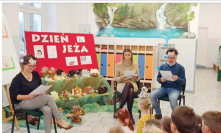
W nowych domkach kolczaste zwierzątka będą mogły czuć się bezpiecznie, a przede wszystkim pozwoli im to przetrwać zimę.

– Nasi uczniowie wiedzą, że w Polsce jeże objęte są częściową ochroną. To znaczy, że mamy obowiązek im pomagać. Są niezwykle pożyteczne dla naszych lasów i ogrodów, dlatego postanowiliśmy poświęcić temu miłemu, choć kłującym ssakowi, więcej uwagi w naszej szkole. Uczniowie poznali ciekawostki z życia jeży, obejrżeli prezentację młodszych dzieci, wzięli udział w quizie z nagrodami, poznali laureatów konkursu na figurkę jeża (nagrodami były ciasteczka w formie jeżyków) i obejrżeli występy artystyczne młodszych