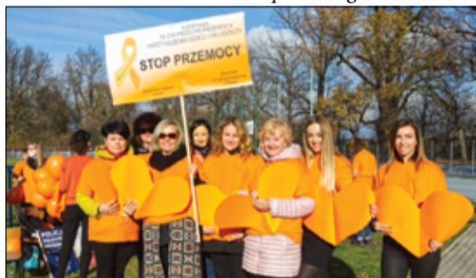
Współorganizatorem kampanii byli pracownicy Ośrodka Pomocy Społecznej w Żarowie.