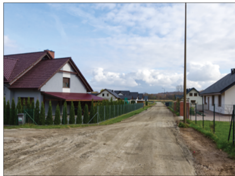
Zmodernizowane drogi zapewnią bezpieczny i wygodny dojazd do pól. Wpłyną na lepsze warunki komunikacyjne na terenach wiejskich i ułatwią transport rolniczy.