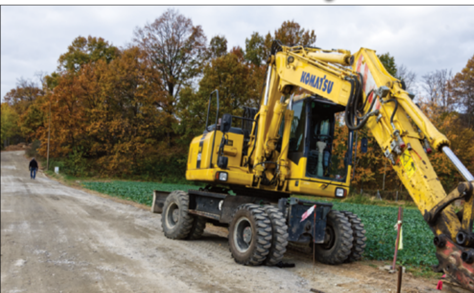
Droga dojazdowa przy ul. Kawalerów Orderu Uśmiechu w Wierzbnej to inwestycja wyczekiwana przez mieszkańców wsi. Więcej informacji na stronie 2.