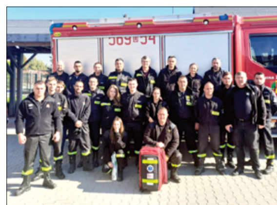
Gratulujemy wszystkim pomyślnego zdania egzaminu i życzymy, aby zdobyta wiedza i nabyte umiejętności ratownicze służyły w razie potrzeby wszystkim mieszkańcom gminy.