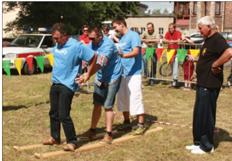
Działalność klubu służy również mieszkańcom gminy Żarów. Na zdjęciu Turniej Wsi – Dni Żarowa, rok 2012.