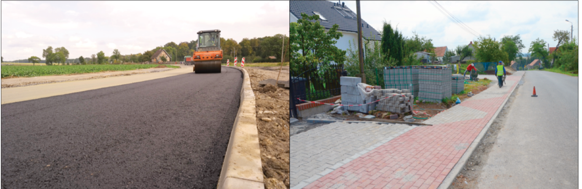
Rozpoczynamy realizację inwestycji drogowych na terenie gminy Żarów. więcej na stronie 3.