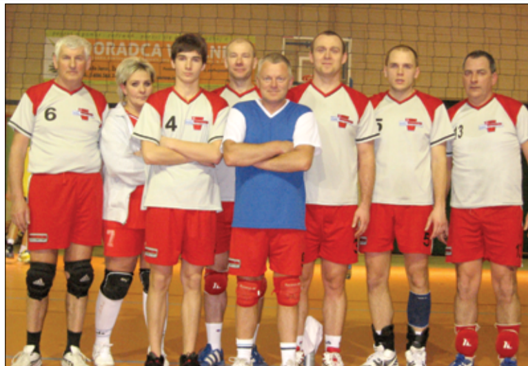
TKKF Chemik Żarów tuż przed meczem derbowym z LKS Chemik Żarów (2010 r.)

Kruk. Po roku 2000 do struktur Chemika Żarów dołącza sekcja koszykówki, która występowała w Świdnickiej Amatorskiej Lidze. Ówczesne czasy, to dominacja siatkarzy Chemika w regionie. Pięć razy z rzędu zwyciężają w Powiatowej Lidze TKKF, najstarszych rozgrywkach amatorów w województwie. Jeśli już mowa o sukcesach, to przez okres swojej działalności TKKF może poszczycić się licznymi osiągnięciami w rozgrywkach na szczeblu powiatowym, wojewódzkim i makroregionalnym. Obecnie w klubie trenuje blisko 30 siatkarzy z różnych miejscowości naszego regionu. Największym problemem dzisiaj