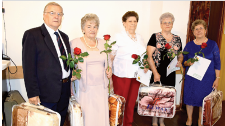
Na zdjęciu członkowie Związku Emerytów Rencistów i Inwalidów w Żarowie, którzy w tym roku obchodzili swoje 75 urodziny.