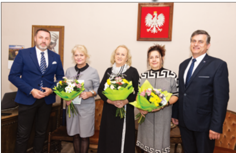
Tradycyjnie w Dniu Edukacji Narodowej podziękowania składamy dyrektorom szkół podstawowych z gminy Żarów. relacja na stronie 4.