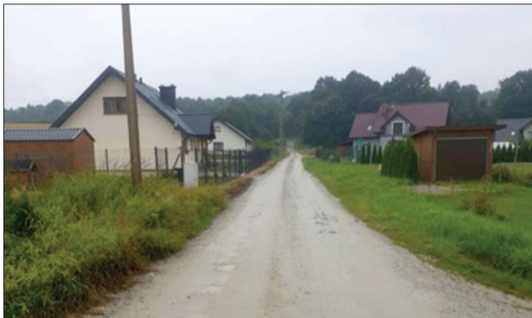
To dobra informacja dla mieszkańców Wierzbnej. Niebawem będą mogli korzystać również z odnowionej nawierzchni asfaltowej przy ul. Kawalerów Orderu Uśmiechu.