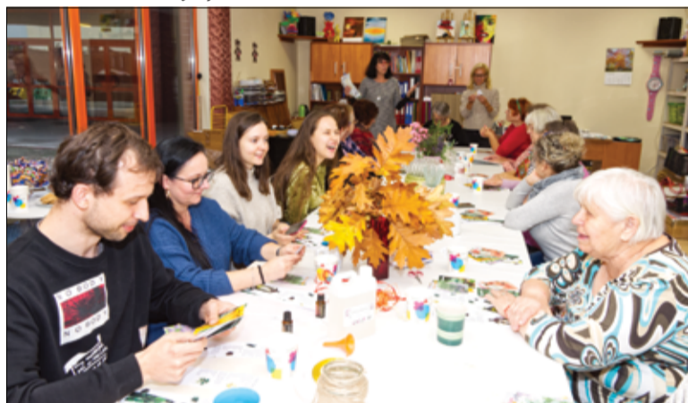
Jeśli tak mają wyglądać jesienne październikowe wieczory, to jak najbardziej jesteśmy „za”.