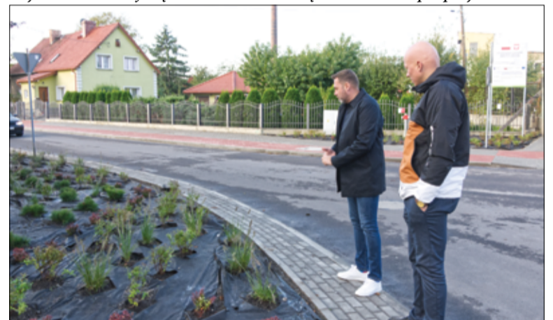
Drzewa, krzewy i byliny są wysiewane i sadzone na terenie miasta w kilku sezonach w ciągu roku. Wiosną są to głównie nasadzenia bylin i roślin jednorocznych. W tym czasie powstają także łąki kwietne. Z kolei jesienią na terenie miasta pojawiają się nowe drzewa i krzewy.

już nowa włóknina, a wkrótce posadzonych zostanie 60 sztuk róży. Wśród nasadzeń będą berberysy, tawuły japońskie, irgi, sosny górskie, trzcinniki, rozplenie japońskie, turnie zwyczajne. Estetyczniej zrobi się także na skarpie przy Parku