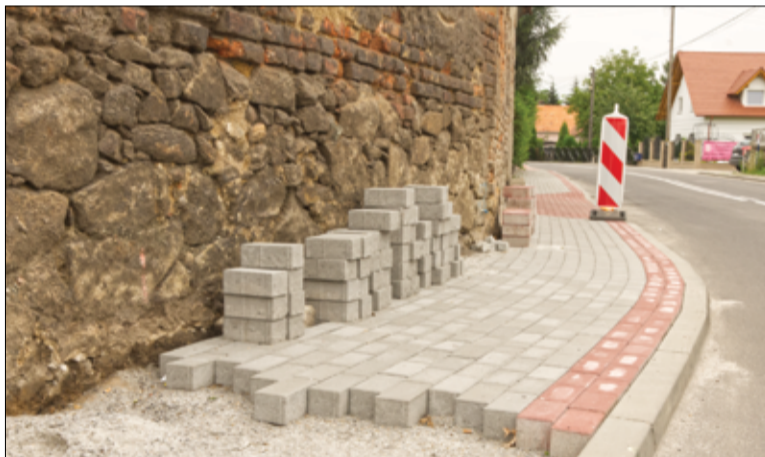
Niebawem mieszkańcy będą mogli również korzystać z wyremontowanych chodników na terenach wiejskich.

nika, powstaną 2 studnie rewizyjne z dopływem i odpływem, 2 wpusty uliczne, dołożona będzie masa asfaltowa do nowo ułożonych krawężników. Koszt budowy chodników w Imbramowicach oraz Łażanach to kwota 54.735,00 zł. Budowa chodników będzie