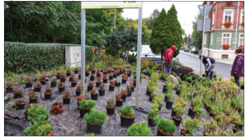
Teren u zbiegu ulic Wojska Polskiego i Dworcowej obsadzony został nowymi roślinami.

– Nowe drzewa i krzewy przybędą głównie na skwerach, skarpach, a także na terenie przy fontannie usytuowanej przy ul. Dworcowej w Żarowie. Tutaj położona została