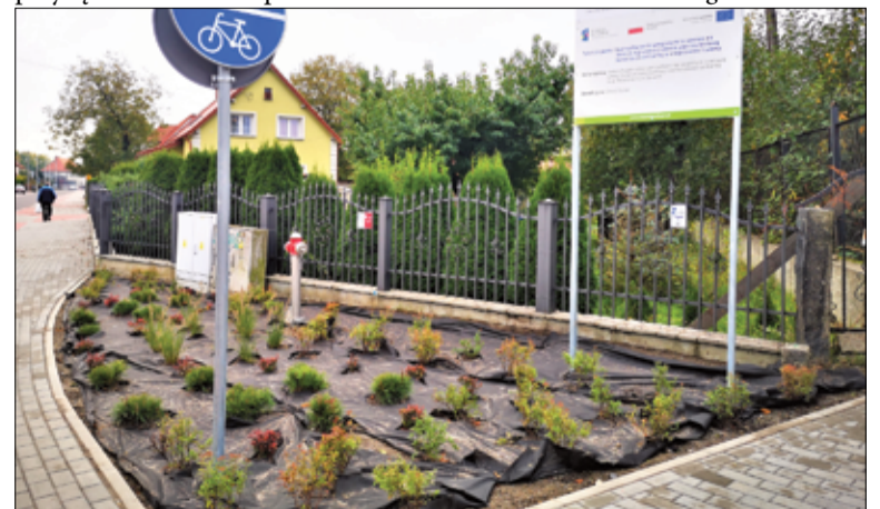
Ulica Słowiańska została w tym roku wyremontowana, a dzięki nowym nasadzeniom na skwerach zrobi się estetyczniej.