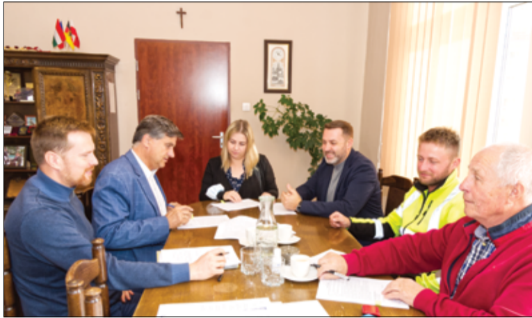
Umowa na remont drogi w Wierzbnej została podpisana ze Świdnickim Przedsiębiorstwem Budowy Dróg i Mostów.

Remont drogi zakończy się jeszcze w tym roku kalendarzowym. Całkowity koszt zadania wynosi: 568.375,62 złotych. Na remont drogi gmina Żarów otrzymała dofinansowanie z Urzędu Marszałkowskiego Województwa Dolnośląskiego w wysokości 157.500 zł. Mieszkańcy wsi czekają również na budowę nowych chodników. W Imbramowicach przy drodze powiatowej powstanie nowy ciąg pieszy o długości 61 metrów bieżących, w Mielęcinie o długości 16 metrów bieżących. W ramach zadania przykryty zostanie również rów na całej długości chod-