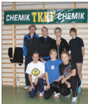
Chemik Żarów – żeńska drużyna mistrzyni województwa amatek, rok 2010.