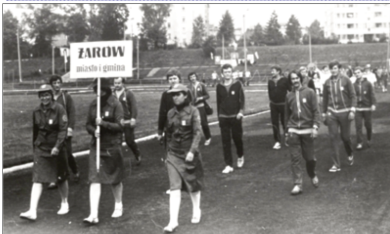
Złot wojewódzki TKKF w Kłodzku, rok 1978.

do współzawodnictwa, to nie sposób powiedzieć o turniejach siatkarskich. Ilość przeprowadzonych rozgrywek jest imponująca. My wymienimy tylko te najważniejsze, do których zaliczamy: Mistrzostwa Dolnego Śląska Amatek w siatkówce, Memoriał im. Edwarda Sypniewskiego (15. edycji), zawody o puchar Burmistrza Miasta Żarów oraz turniej Prezesa klubu.