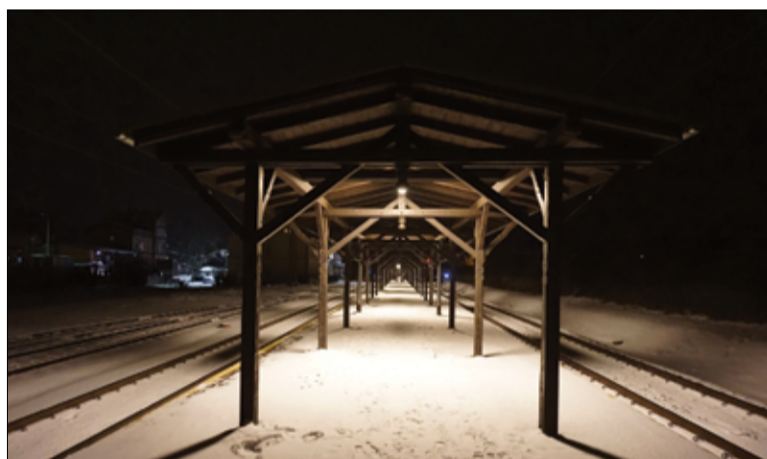
Wiatę peronową na stacji PKP w Żarowie w scenerii zimowej. Zdjęcie zajęło II miejsce w konkursie.