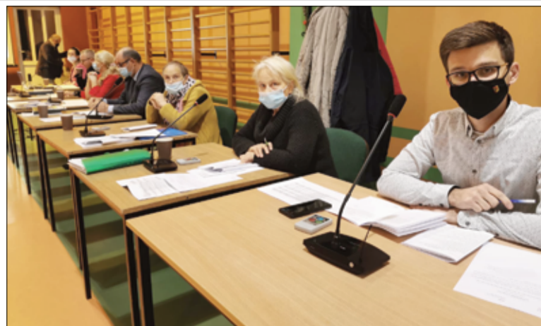
Radni Rady Miejskiej jednogłośnie poparli projekt uchwały w sprawie ustanowienia nowych pomników przyrody na terenie gminy Żarów.

– W drugim etapie prac wyłożona zostanie masa asfaltowa. Przygotowujemy się do złożenia wniosku o dofinansowanie, które przeznaczone będzie na kontynuację tej inwestycji. Nabór wniosków ma zostać ogłoszony jeszcze w tym roku. Zadanie to realizowaliśmy wspólnie z Kopalnią Granitu Siedlimowice, która zgodnie z podpisanym porozumieniem, zakończyła pierwszy etap prac. Inwestycja była bardzo ważna dla naszych mieszkańców. Obwodnica w znaczący sposób