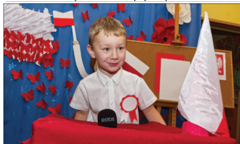
Zainteresowani posłowie podchodzili do mównicy i zgłaszali swoje propozycje do ustawy o „Prawach dziecka”.