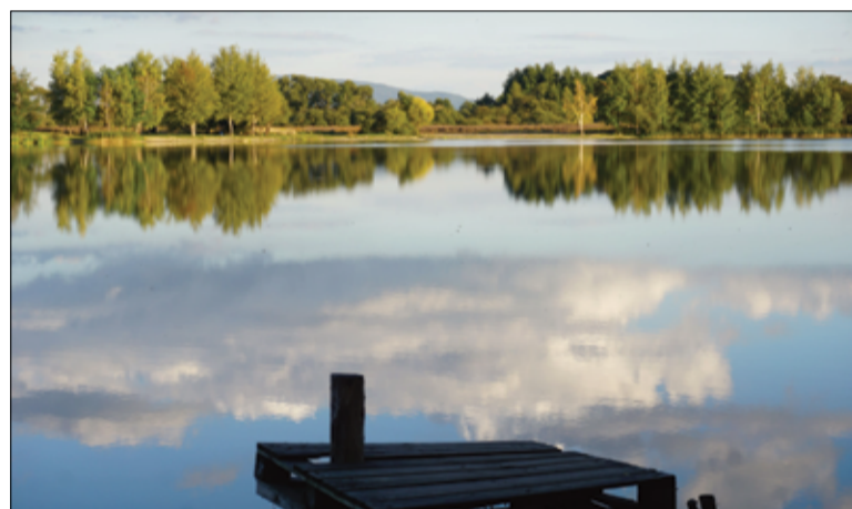
Widok na zalew „Andrzej” w Żarowie.