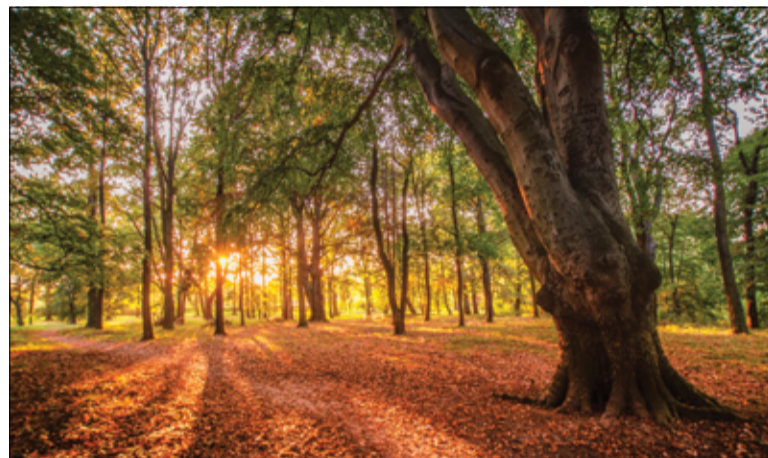
Parki Miejski w Żarowie.