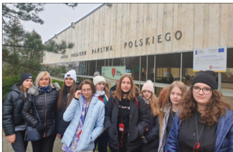
Uczenie się oparte na praktycznym odkrywaniu śladów historii, czy też eksperymentowaniu w centrach nauki, stworzyło uczniom warunki do zdobywania nowych umiejętności.

Szkoła Podstawowa im. UNICEF w Imbramowicach. Uczniowie klas I-III zwiedzali Krasiejów i Park Dinozaurów oraz Opole, gdzie udali się do Muzeum Wsi Opolskiej. 8 grudnia zaplanowana została wycieczka również dla uczniów klas IV-VIII. Uczniowie wybiorą się do Wrocławia, gdzie odwiedzą Muzeum Przyrodnicze Uniwersytetu Wrocławskiego oraz Centrum Historii Zajezdnia. Program „Poznaj Polskę” ma na celu uatrakcyjnienie procesu