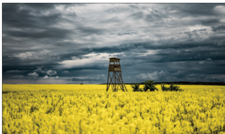
Ambona myśliwska w rzepaku nieopodal Bożanowa. Zdjęcie zajęło III miejsce w konkursie, autor: Marcin Rój.