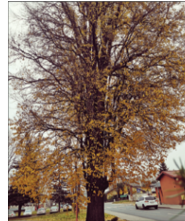
Wiąz pospolity w Żarowie.