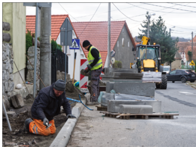
Budowa ciągu pieszego ruszyła także w Wierzbnej.

– Korzystać z nowych chodników mogą już mieszkańcy Mrowin oraz Łażan. Kolejny etap prac przy remoncie chodników jest również prowadzony przy ul. Świdnickiej w Wierzbnej