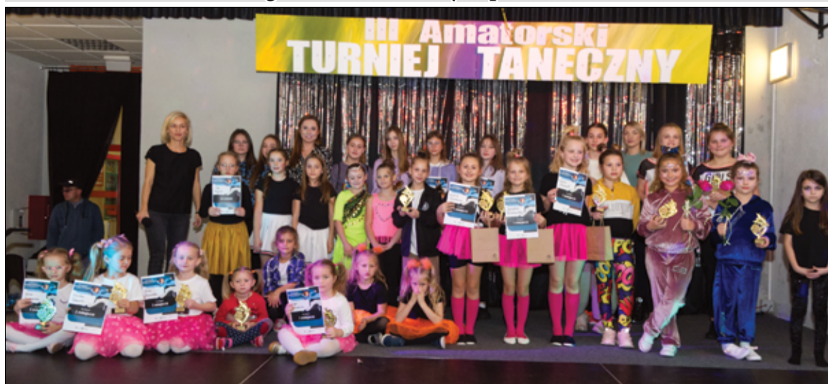
Wszyscy uczestnicy turnieju zaprezentowali się przed publicznością na scenie GCKiS.