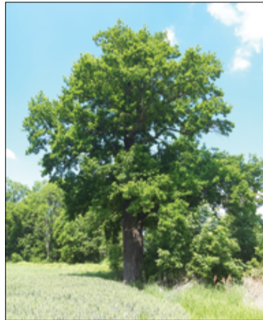
Dąb szypułkowy w Imbramowicach.