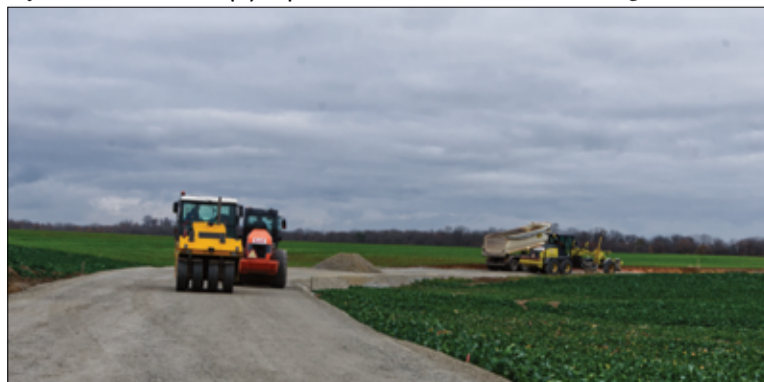
Pierwszy etap prac przy budowie obwodnicy Pożarzyska zakończony.