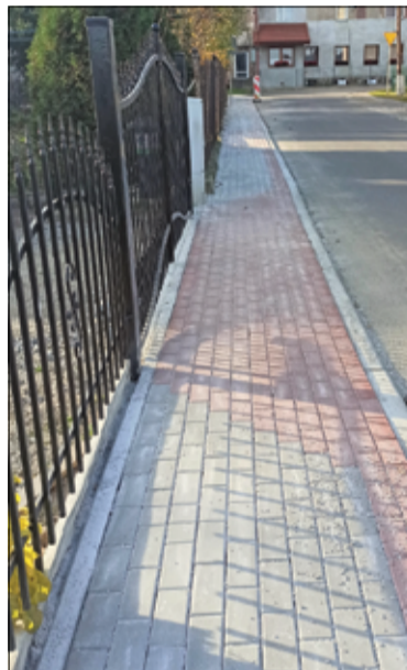
Do użytku oddany został również nowy chodnik w Łażanach.

Zakończyła się budowa nowych ciągów pieszych w Mrowinach i Łażanach, a w tej chwili prace prowadzone są w Wierzbnej, Kalnie oraz Zastrużu. Do użytku mieszkańców oddane zostaną także odcinki nowych chodników przy drogach powiatowych w Bukowie, Mielęcinie oraz