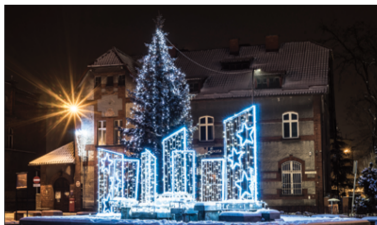
Oświetlona fontanna na tle Urzędu Pocztowego w Żarowie.

umowę wyłącznie w przypadkach określonych w art. 36 ust. 3 ustawy o ROD, tj. jeżeli działkowiec: