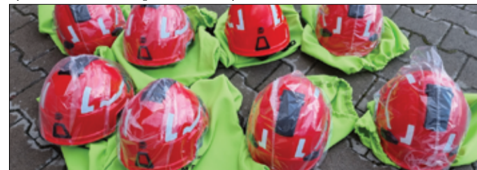
Kolejny nowy sprzęt trafi do jednostki Ochotniczej Straży Pożarnej w Żarowie.

Warto zaznaczyć, że OSP Żarów jest jednostką najczęściej wyjeżdżającą do różnych zdarzeń z terenu gminy Żarów (ponad 180 wyjazdów w 2020r.) i wymiana oraz zakup nowego sprzętu jest bardzo ważna dla ochrony życia strażaków oraz poszkodowanych.