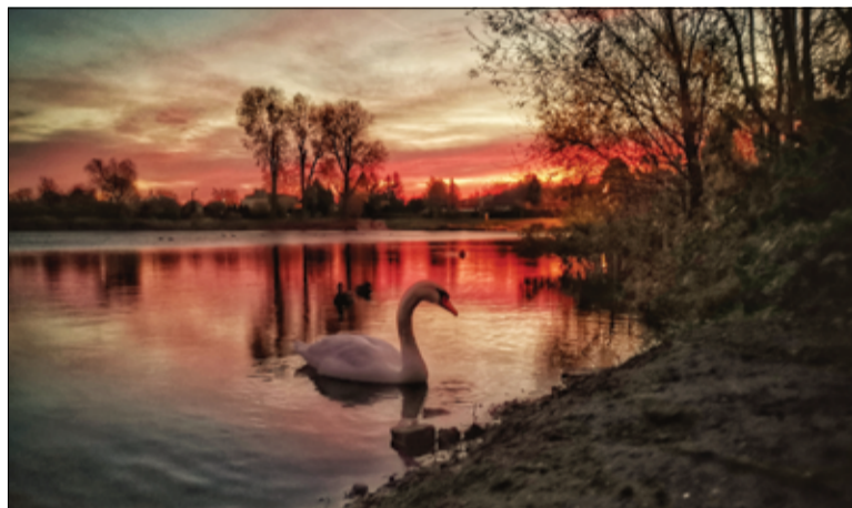
Wschód słońca nad stawem miejskim w Żarowie. Zwycięskie zdjęcie autorstwa Grzegorza Lewickiego.