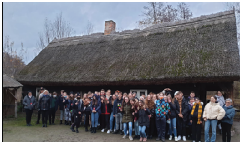
Uczniowie SP Żarów przed Rezerwatem Archeologicznym w Biskupinie.

Pieniądze przeznaczone są na organizację wycieczek szkolnych w 2021r. w ramach przedsięwzięcia „Poznaj Polskę” – Program Rządowy Polski Ład. Całkowity koszt zadania to kwota 33.450 złotych. Dzięki dodatkowym środkom finansowym, o które wnioskowali pracownicy Referatu Organizacyjnego Urzędu Miejskiego w Żarowie, uczniowie mogli wybrać się na zaplanowane edukacyjne wycieczki szkolne. Miejsca wycieczek zostały wybrane przez szkoły z przygotowanej przez Ministerstwo Edukacji i Nauki listy priorytetowych obszarów edukacyjnych. Muzeum Kultury Ludowej Pogórza Sudeckiego i Muzeum Papiernictwa w Dusznikach-Zdrój zwiedzali uczniowie klas III Szkoły Podstawowej im. Jana