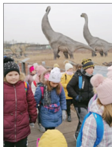
W Parku Dinozaurów czekało na uczniów SP Imbramowice wiele atrakcji.

Brzechwy w Żarowie. Z kolei ósmoklasiści w ramach programu „Poznaj Polskę” wybrali się do Muzeum Początków Państwa Polskiego w Gdańsku, zwiedzali Katedrę pw. WNMP i Św. Wojciecha w Gnieźnie, Rezerwat archeologiczny Biskupin oraz Poznań – historyczny zespół miasta. Ciekawy program wycieczek dla uczniów zaplanowała także