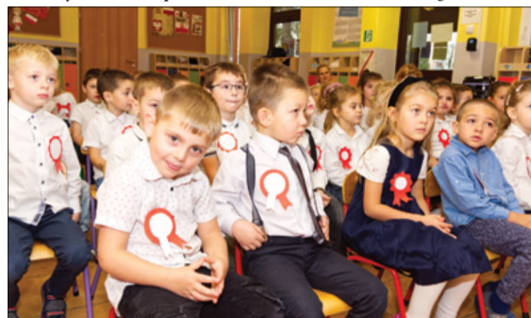
Każdego roku Bajkowe Przedszkole w Żarowie „zamienia” się na jeden dzień w salę sejmową.