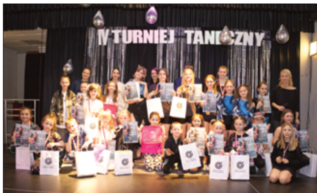
Każdy występ był niepowtarzalny i jedyny w swoim rodzaju. Gratulacje dla uczestników i wielkie brawa dla organizatorów turnieju GCKiS w Żarowie.

– Była to znakomita okazja do podziwiania zmagających tanecznych naszych młodych tancerzy. Do tego