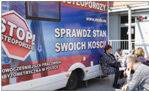
W ramach Dnia Zdrowia i Profilaktyki Żarowianie mogli zbadać sobie gęstość kości w Osteobusie.

W ramach Dnia Zdrowia i Profilaktyki zaprosiliśmy także do Żarowa przedstawicieli Narodowego Funduszu Zdrowia, Sanepidu, Świdnickie Stowarzyszenie