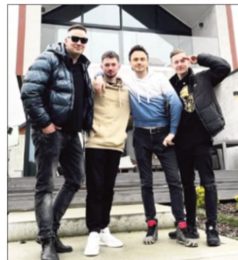
Koncerty zespołu After Party to mega wydarzenie i mega show. Zespół wystąpi podczas Dni Żarowa.

Wanda i Banda – to kultowa rockowa kapela, która głównie kojarzona jest z serialem „Siedem życzeń”. W swoim repertuarze ma takie przeboje jak: HI-FI, Nie będę Julią, Czy to szczęście