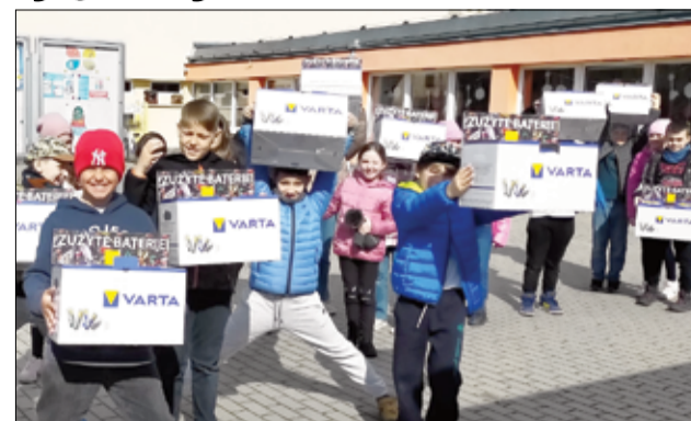
Choć są bardzo młodzi, wiedzą, że należy dbać o środowisko. Uczniowie SP Żarów dają wszystkim dobry przykład. Brawo, trzymajcie tak dalej!

Informacja: Szkoła Podstawowa im. Jana Brzechwy w Żarowie