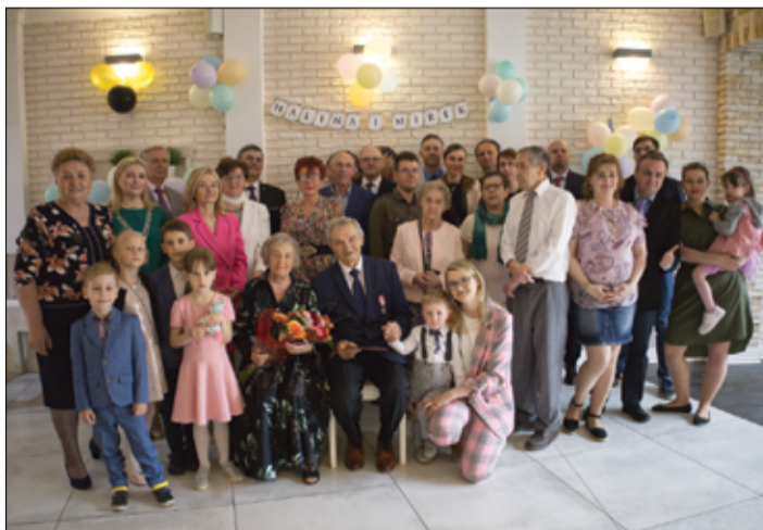
Jubilatom w tym dniu towarzyszyli rodzina oraz znajomi i przyjaciele.

Państwo miłość, wierność i uczciwość małżeńską... I w tej przysiędze trwacie po dziś dzień. Każdego dnia swoją miłością i wzajemną troską dodajecie sobie sił i sprawiacie, że wspólne życie jest piękniejsze. Z całego serca Państwu gratuluję i życzę zdrowia, pogody ducha, radości oraz wielu wspólnie przeżytych chwil – gratulował parze