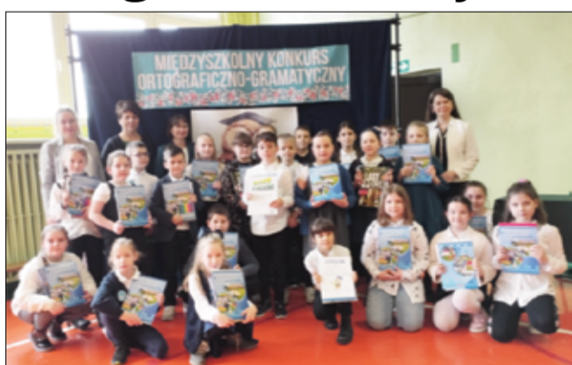
Na zdjęciu uczestnicy konkursu wraz z organizatorami.

– Konkurs składał się z dyktanda i testu sprawdzającego wiedzę z zakresu ortografii i gramatyki. Mimo tego, że zadania były niełatwe, trudności ortograficzne rozmaite, to uczestnicy odważnie zmierzili się z zawiłościami języka polskiego