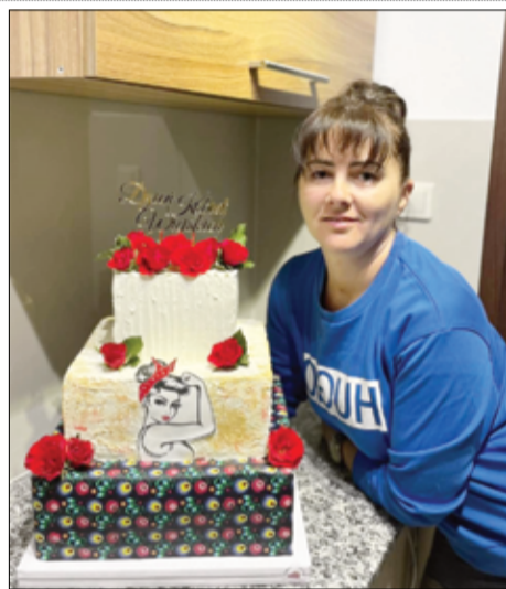
Choć nie uczyła się zawodu cukiernika, to właśnie cukiernictwo jest jej ogromną pasją.

– W 2021r. zajęłam II miejsce w konkursie na „Najpiękniejszy przydomowy ogród”. Ogrodnictwo to moja druga pasja i hobby. Ogród to oaza spokoju, odpoczynku i relaksu. W pielęgnację ogrodu włożyliśmy mnóstwo pracy. Razem z mężem i dziećmi robiliśmy i tworzyliśmy ten ogród. Wspólnie zbieraliśmy polne kamienie z pobliskich pól. Razem projektowaliśmy i sadziiliśmy nasze drzewa, krzewy i kwiaty. Ogród wymaga dużo pracy i poświęcenia. Praca w ogrodzie relaksuje i odpręża. Uwielbiam pić w nim kawę i podziwiać każdy rozkwitający kwiat. Mam także dużo zwierząt w ogrodzie. Jaszczurek, które wygrzewają się w słońcu na kamieniach, dużo bąków zbierających nektar z lawend, śpiewających ptaków, a nawet jeża, który zimuje w tujach.