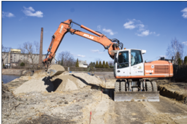
Na końcowy efekt musimy jeszcze poczekać, ale gołym okiem da się już zauważyć pierwsze zmiany.

Sporo ostatnio dzieje się w różnych częściach naszego miasta. Dzięki przeprowadzonym pracom, za kilka miesięcy, kolejne tereny w Żarowie zmienią swój wygląd. Będzie bezpieczniej, estetyczniej, a w niektórych miejscach mocno się zazieleni. Niebawem ruszą także prace przy remoncie alejek