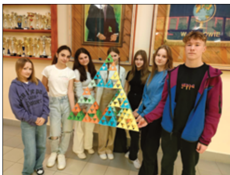
Jak na królową przystało, matematyka obchodziła swoje święto, a uczniowie mogli spojrzeć na matematykę z innej i to lepszej strony.

– Termin obchodów szkolnego święta nie był przypadkowy. To właśnie tego dnia obchodzony jest światowy dzień liczby Pi. Dlatego też ta liczba była bohaterką wielu zadań wykonywanych przez uczniów. Uczniowie uświadomili sobie, że matematyka jest ważnym elementem