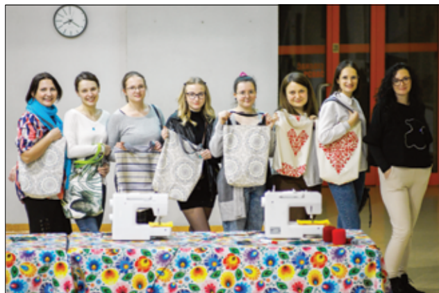
Warsztaty krawieckie, które odbyły się w Żarowie cieszyły się dużym zainteresowaniem naszych mieszkank.