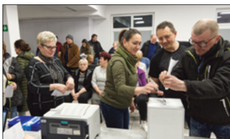
Zebranie wiejskie w Łazanach podczas którego wybierano nowego sołtysa zgromadziło wielu zainteresowanych mieszkańców.

– Cieszę się, że dzisiejszym wyborom nowego sołtysa towarzyszy tak duża frekwencja. Gratuluję nowemu gospodarzowi wsi i życzę samych sukcesów