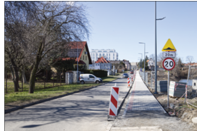
W ramach rewitalizacji stawu powstał już chodnik oraz nowe oświetlenie.

– Przy ul. Wiosennej, Jaworowej i Topolowej trwają prace inwestycyjne. Stara nawierzchnia asfaltowa została zerwana, remontowana jest sieć wodociągowa i układane są rury pod kanalizację deszczową. Prosimy mieszkańców o cierpliwość, bo trzeba liczyć się z utrudnieniami drogowymi. Prace potrwać jeszcze kilka miesięcy, ale w efekcie na