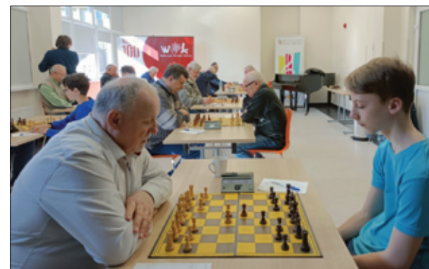
W wałbrzyskiej okręgowej szachistki Gońca Żarów rozegrali kolejne pojedynki, fot. źródło: FB Goniec Żarów.

Dwie drużyny Gońca Żarów rywalizowały w Wałbrzychu w ramach Wałbrzyskiej Ligi Okręgowej 2022/23. Bilans to dwie wygrane i dwie przegrane. 8 runda: WOK Wałbrzych I – GLKS Goniec Żarów II 4 : 1 (remis: Zieliński, Król). WOK Wałbrzych II – GLKS Goniec Żarów III 0,5 : 4,5 (wygrane: Szerszeń, Chołody, Kiszkiel, Kiszkiel, remis: erwin). 9 runda GLKS Goniec Żarów II – WOK Wałbrzych II 4,5 : 0,5 (wygrane: Zieliński, Cygan, Adamek, Bednarski, remis: Król). GLKS Goniec Żarów III – WOK Wałbrzych I 1,5 : 3,5 (wygrana: Chołody, remis: Kiszkiel).