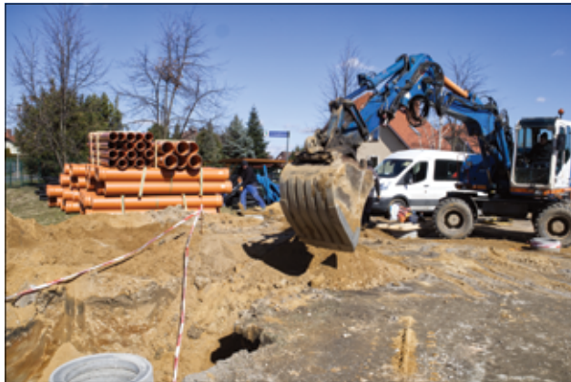
Już niebawem do użytku mieszkańców oddane zostaną kolejne wyremontowane drogi asfaltowe.

gowej. Oprócz nowej infrastruktury, która pojawi się w tym miejscu (ławki, kosze na śmieci, tablice informacyjne, leżaki, stoliki do gry w szachy) jedną z większych atrakcji będzie pływająca fontanna. Cały teren upiększą także liczne nasadzenia, drzewa, krzewy i kwiaty, które zgodnie z projektem, zdobić będą teren stawu miejskiego w Żarowie. Wartość inwestycji łącznie z rewitalizacją Parku Miejskiego w Żarowie wynosi 5.261.053,10 złotych, z czego 4.500.000 złotych to dofinansowanie, które gmina