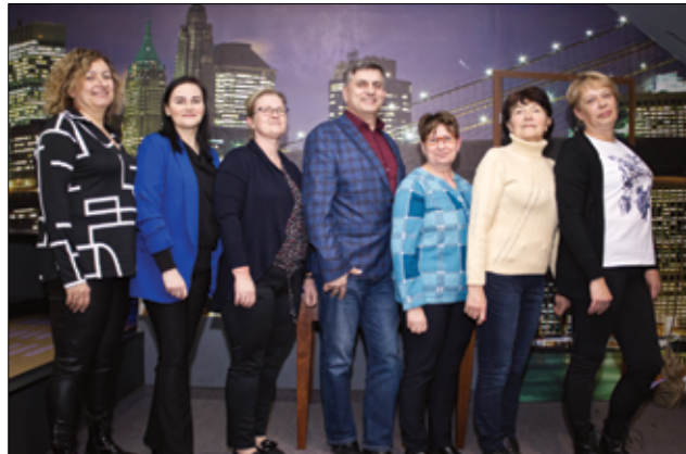
Liderki naszych sołectw – sołtyski w gminie Żarów.