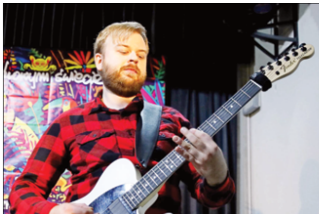
Największą pasją Pana Macieja jest gra na gitarze. Swoją pasją zaraża również dzieci i młodzież podczas zajęć w GCKiS.

– Nauka gry na gitarze zaczęła się u mnie już w szkole podstawowej. W wieku 10 lat zacząłem chodzić do szkoły muzycznej, gdzie głównie uczyłem się grać muzykę klasyczną, a także poznawałem teorię muzyki. Na początku grałem na gitarze klasycznej, lecz moim marzeniem od zawsze była gitara elektryczna, a wiązało się to głównie z moim gustem muzycznym. Aby spełnić swoje marzenie pracowałem przez całe wakacje, żeby zarobić na instrument wraz ze wzmacniaczem. W wieku 19 lat rozpocząłem naukę w Wrocławskiej Szkole Jazzu i Muzyki Rozrywkowej. Obecnie zajmuję się również nauką gry na gitarze w GCKiS w Żarowie, gdzie uczy dzieci oraz młodzież