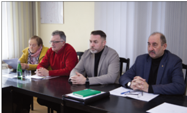
Głównym tematem komisji było zatwierdzenie planów łowieckich na 2023/2024 rok.

– Komisja Rolnictwa zatwierdziła plany łowieckie, o których rozmawialiśmy w trakcie spotkania z przedstawicielami kół łowieckich. Roczny plan łowiecki jest sporządzany przez dzierżawcę obwodu łowieckiego na okres od 1 kwietnia do 31 marca, po zasięgnięciu opinii Burmistrza oraz właściwej Izby Rolniczej i podlega zatwierdzeniu przez nadleśniczego Państwowego Gospodarstwa Leśnego Lasy Państwowe w uzgodnieniu z Polskim Związkiem Łowieckim. Informacje zawarte w rocznych planach polowań dotyczyły szacowanej liczebności występujących zwierząt