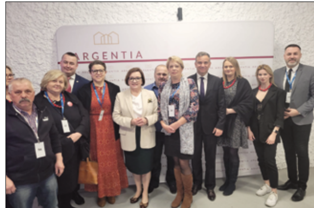
Spotkanie liderów wsi w Dzierżoniowie, gdzie wręczane były podziękowania dla sołtysów.

Z okazji Dnia Sołtysa także w Dzierżoniowie odbyło się spotkanie sołtysów z regionu wałbrzyskiego, podczas