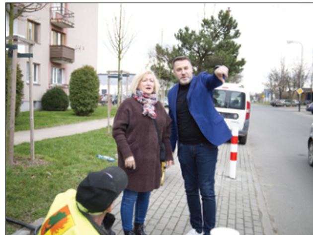
W celu poprawy bezpieczeństwa przy parkingu na ul. Łokietka w Żarowie zostały zamontowane słupki.

– Wspólnie z zastępcą burmistrza Przemysławem Sikorą oraz pracownikami Urzędu Miejskiego w Żarowie zorganizowaliśmy