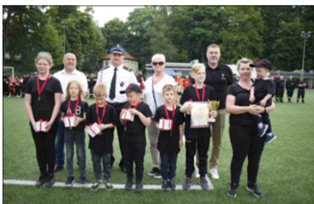
W zawodach strażackich uczestniczyli również najmłodsi mieszkańcy naszej gminy.