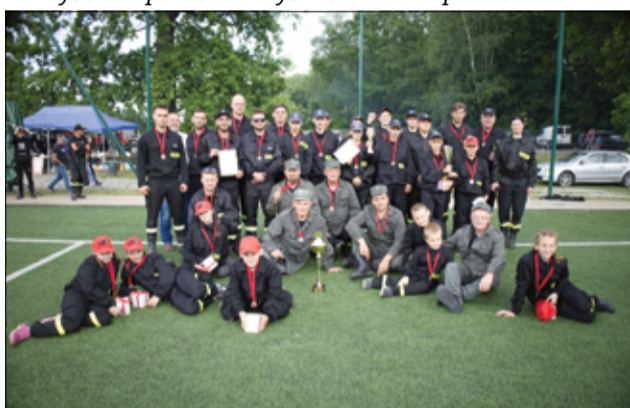
Nie sportowa rywalizacja była najważniejsza, ale dobra wspólna zabawa. Na zdjęciu zwycięzcy zawodów OSP Mrowiny.