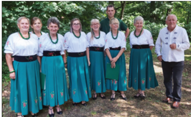
Razem śpiewają od prawie 10 lat i wciąż traktują to jako wspaniałą przygodę, odskocznię od codziennych domowych i zawodowych obowiązków.