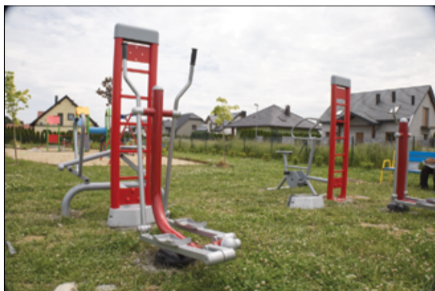
Do dyspozycji mieszkańców jest także plenerowa siłownia.

– Na placu zabaw przy ul. Wierzbowej w Żarowie pojawiły się nowe atrakcje dla najmłodszych mieszkańców naszego miasta. Do ich dyspozycji są nowe urządzenia zabawowe, które mamy nadzieję, zachęcą dzieci do spędzenia czasu na świeżym powietrzu. Ponadto, przy ul. Wierzbowej zamontowaliśmy także urządzenia siłowni zewnętrznej, małej architektury (ławki, kosze na śmieci), tablicę z regulaminem siłowni, tablicę infor-