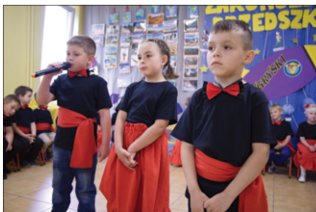
To były wspaniałe chwile w Bajkowym Przedszkolu w Żarowie. Od nowego roku szkolnego dzieci będą już uczniami szkół podstawowych.