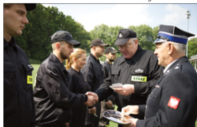
Podczas zawodów uhonorowaliśmy także strażaków odznaczeniami.