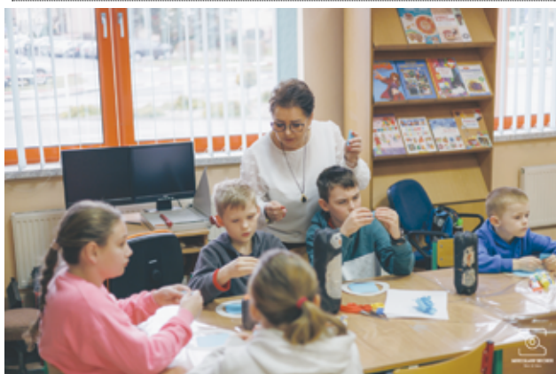
Mnóstwo zajęć biblioteka w Żarowie oferuje także naszym najmłodszym mieszkańcom.

„Sobotnie rodzinne poczytajki” oraz lekcje biblioteczne.