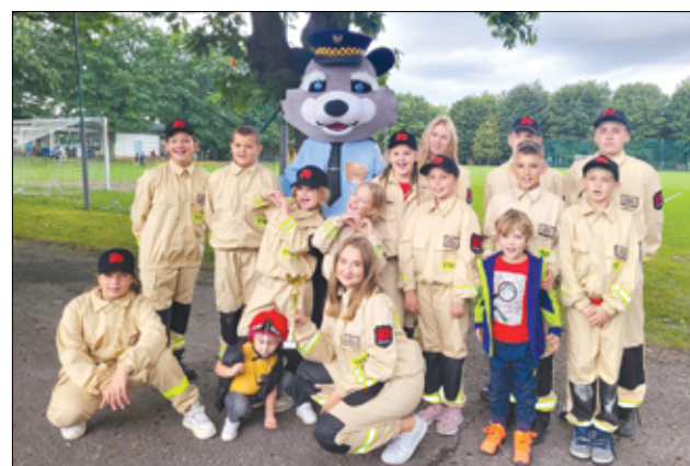
Drużyna z MDP Wierzbna spisała się na medal. I to dostojnie, bo wywalczyła drugie miejsce.