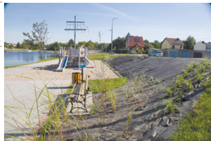
Drzewa, krzewy, kwiaty i liczne nasadzenia wzbogacą teren zielony przy stawie miejskim.

W tej chwili trwają tam prace związane z nasadzeniem roślin, krzewów i kwiatów, które zmienią i upiększą teren przy stawie miejskim w Żarowie. Niebawem posadzone zostaną również drzewa. Staw miejski przy ul. Wyspiańskiego w Żarowie i jego otoczenie już zmieniły swój wygląd, choć prace jeszcze się nie zakończyły. Większość prac zostało już zrealizowanych, kilka dni temu zainstalowano nowe ławki i kosze na śmieci, a w kolejnym etapie przygotowane zostaną także stoliki do gry w szachy, leżaki i pływająca fontanna. Będzie to piękny zielony zakątek w naszym mieście. Miejsce, gdzie wypoczniemy na świeżym powietrzu, w otoczeniu przyrody. Przypomnijmy, że prace przy rewi-