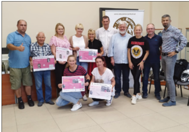
GCKiS będzie realizowało kolejny ciekawy projekt. Wspólne odkrywanie tajemnic już niebawem.

Gminne Centrum Kultury i Sportu w Żarowie znalazło się wśród dziesięciu instytucji kultury w Polsce, które otrzymały dofinansowanie w programie Dom Kultury+ „Partnerstwo Lokalne”.