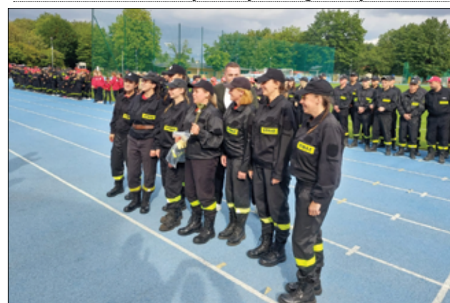
Duży sukces odnotowały także seniorki z OSP Pożarzysko, zdobywając drugie miejsce na podium.