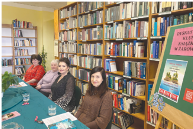
Seniorzy chętnie spotykają się w bibliotece, aby uczestniczyć w różnych ciekawych warsztatach.

dzieci i młodzieży staje się coraz bardziej przyjazny, tworzymy klimatyczne kącki do spędzania wolnego czasu przez użytkowników. Na dzieci i młodzież czeka szereg akcji między innymi „Spotkania autorskie”, „Noc Bibliotek”, „Ferie z biblioteką”, „Wakacje w bibliotece”,