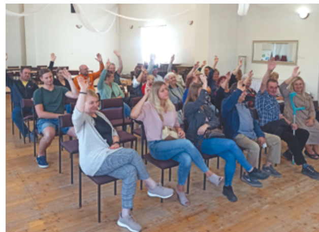
Mieszkańcy wsi zgodnie rozdysponowali środki funduszu sołeckiego.

Magdalena Pawlik na podstawie informacji z UM Żarów