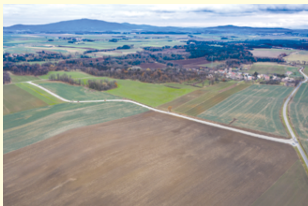
Pozyskana przez gminę Żarów dotacja pozwoli na realizację kolejnego etapu prac przy budowie obwodnicy Pożarzyska.

6. Konserwacja techniczna i estetyczna drewnianej polichromowanej i złożonej ambony barokowej z kościoła parafialnego w Bukowie, gmina Żarów: kwota pozyskanej dotacji 161.363,33 zł. Remont będzie obejmował demontaż, a następnie montaż elementów ambony. Wykonanie badań stratygraficznych. Mechaniczne oczyszczanie z kurzu i brudu. Dorzeźbienie brakujących elementów formy rzeźbiarskiej. Rekonstrukcję złożenia