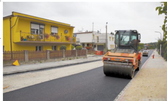
Droga przy ul. Wiosennej w Żarowie z nową nawierzchnią asfaltową.

– Kończymy prace związane z remontem dróg w tym miejscu na osiedlu domków jednorodzinnych. To kolejne ważne zadanie drogowe na terenie naszego miasta, a przed nami następne. Dzięki nowym nawierzchniom drogowym mieszkańcy będą mieli lepszy dojazd do swoich domów i posesji. Ale nie tylko. Wymieniliśmy także awaryjne sieci wodociągowe, przebudowaliśmy również skrzyżowanie przy ul. Wiosennej, Jaworowej, Jarzębinowej i Pogodnej. Powstały nowe chodniki, oświetlenie oraz bezpieczne przejścia dla pieszych. Inwestycje w tym miejscu są jeszcze kontynuowane, ale nie będą one już tak