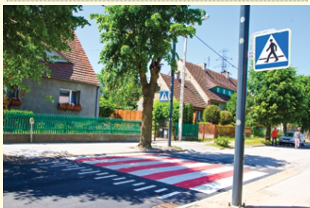
Wśród zadań, które zostaną zrealizowane, będą także inwestycje zwiększające bezpieczeństwo.

i srebrzeń wykonanych w technice oryginału i wiele innych czynności.