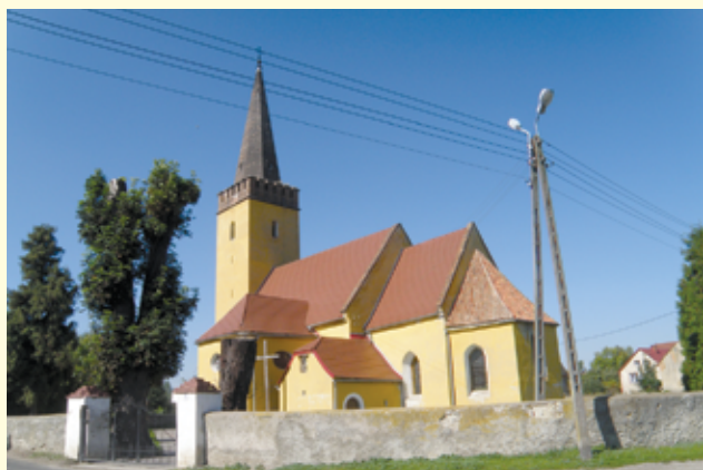
Kolejne zabytki na terenie naszej gminy zostaną wyremontowane.