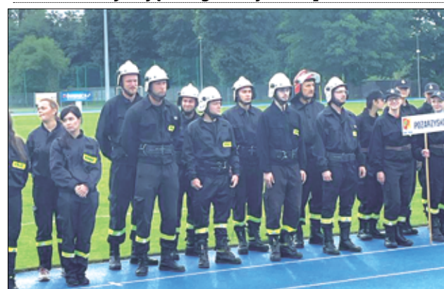
Nasi Panowie z OSP Mrowiny uplasowali się na 4. miejscu na cały powiat. To również duży sukces!

i reprezentowanie naszej gminy oraz gratulujemy uzyskanych wyników. Drodzy strażacy dziękujemy za Waszą pomoc przy organizacji różnych ważnych wydarzeń i za to, że zawsze można na Was liczyć. Nigdy nie odmawiacie pomocy i czynicie to z głębi serca