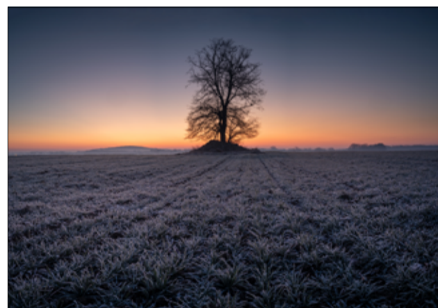
Fotografia przedstawiająca drzewo na drodze Mielęcín – Łażany to jedno ze zdjęć Grzegorza Lewickiego mieszkańca Żarowa.