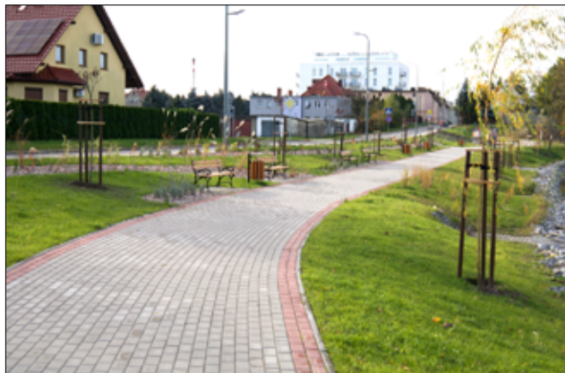
Staw miejski po rewitalizacji, choć prace jeszcze się nie zakończyły, zmienił swój wizerunek.

– To już ostatni etap prac, jaki prowadzimy nad stawem miejskim w Żarowie. Teren ten zmienił swój wygląd, a mieszkańcy zyskali kolejną wyremontowaną i zagospodarowaną od nowa przestrzeń do spędzania wolnego czasu. Efekty zrealizowanych prac widać gołym okiem, zakres prac został prawie w całości wykonany. Czekamy jeszcze na montaż pływającej fontanny, która z pewnością uczyni to miejsce jeszcze bardziej atrakcyjniejszym. Przypomnę, że w ramach rewitalizacji stawu wyremontowane