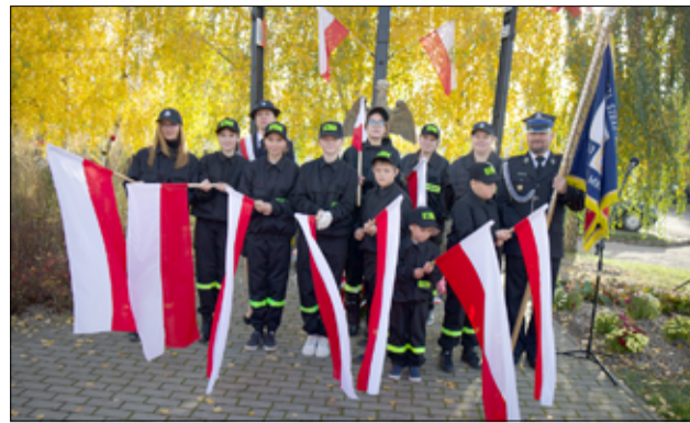
W obchodach Święta Niepodległości dumnie z flagą kroczyli strażacy z Młodzieżowych Drużyn Pożarniczych.