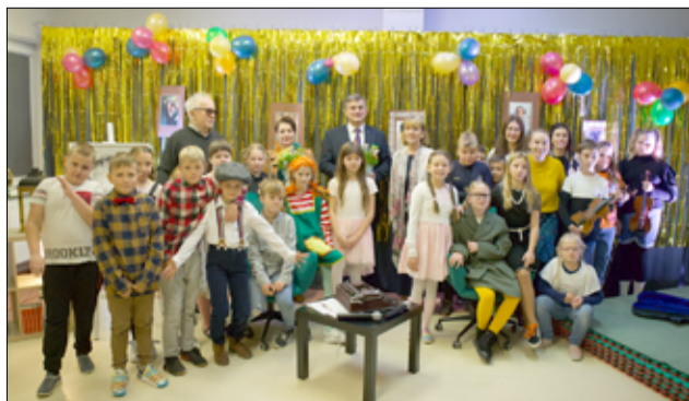
Dzień patrona Szkoła Podstawowa im. Astrid Lindgren w Zastrużu świętowała w gronie uczniów, nauczycieli i przyjaciół szkoły.