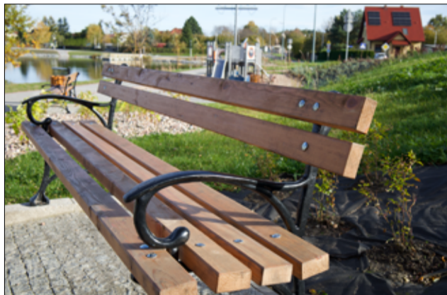
Nowe ławki, pływający pomost, oświetlenie, liczne nasadzenia wpłynęły na poprawę estetyki tego miejsca.