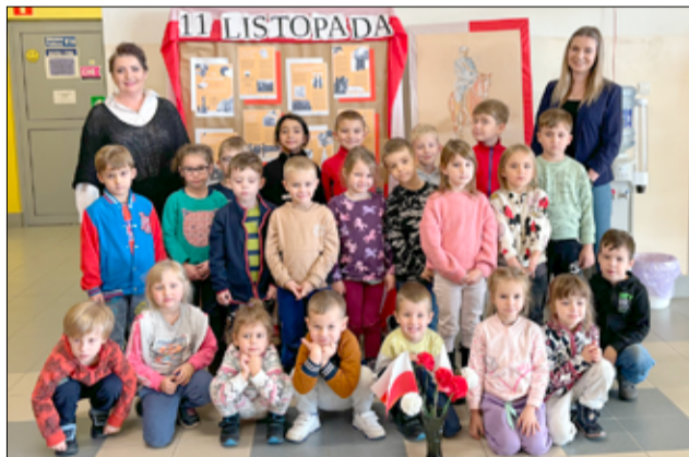
Z okazji Święta Niepodległości biblioteka w Żarowie zorganizowała dla naszych najmłodszych mieszkańców wiele ciekawych warsztatów.

– Biblioteka, stając się miejscem takich interaktywnych i edukacyjnych wydarzeń, odgrywała kluczową rolę w uczczeniu tej ważnej daty dla historii Polski. Spotkania z różnymi grupami, takimi jak klasa 4c ze Szkoły Podstawowej im. Jana Brzechwy, Przedszkole Europejskiej Akademii Dziecka, czy Maluszkowa Grupa Zabawowa, nie tylko celebrowały ten historyczny moment, ale również angażowały uczestników w fascynujące, edukacyjne i interaktywne aktywności. Poprzez podróże pociągami przez symbole narodowe,