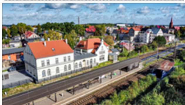
Marcel Maciołek uchwycił na zdjęciu z lotu ptaka ujęcie dworca kolejowego w Żarowie.