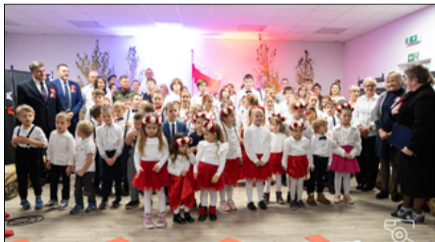
To był piękny przekaz w wykonaniu uczniów z SP Mrowiny i Młodzieżowego Ośrodka Wychowawczego.

Uczniowie oraz nauczyciele placówki zabrali zgromadzonych gości w podróż po trudnych, bolesnych, ale i radosnych kolejach Narodu Polskiego w słowno-muzycznej inscenizacji. Młodzi aktorzy z SP Żarów, SP Mrowiny oraz Młodzieżowego Ośrodka Wychowawczego zaprezentowali w swoim przekazie, jak wiele Polacy musieli przejść, aby dziś każdy z nas mógł cieszyć się wolnością i niepodległością swojego narodu. Piękne, podniosłe dźwięki i melodie wyśpiewane przez dzieci oraz młodzież sprawiły, że wszyscy dali się zaprosić i porwać do wspólnego śpiewu pieśni patriotycznych. Zdolności aktorskie i wokalne młodych aktorów zostały docenione ogromnymi brawami