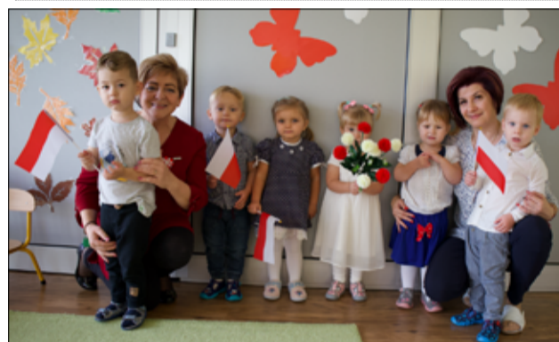
Święto Niepodległości uczyły również maluchy z Żłobka Miejskiego „Bajkowa Kraina” i Bajkowego Przedszkola w Żarowie.