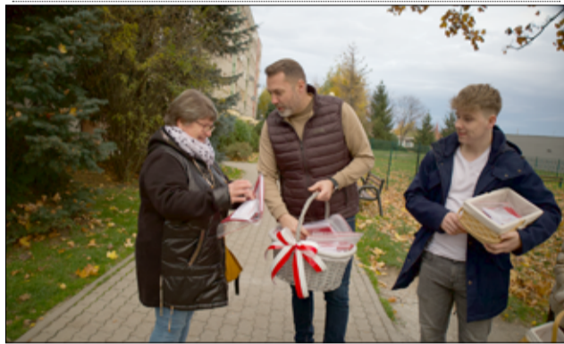
Białoczerwona flaga trafiła także do naszych mieszkańców.