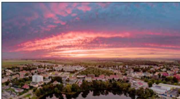
Panorama Żarowa o zachodzie słońca – zdjęcie Grzegorza Lewickiego.

► III miejsce: Marcel Maciołek za zdjęcia przedstawiające: Szkoła Podstawowa w Żarowie, Zamek w Żarowie, dworzec kolejowy w Żarowie, staw miejski w Żarowie, Kościół w Żarowie.