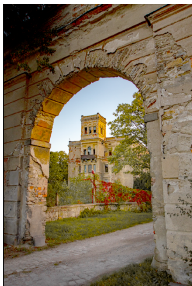
Piękne ujęcie pałacu w Mrowinach w wykonaniu Pavlo Yukhnovskiy.