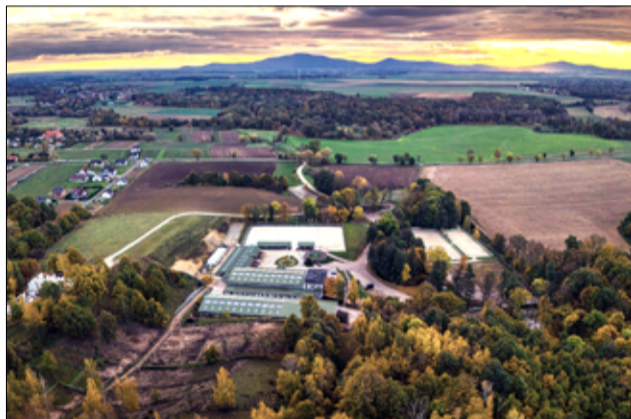
Stajnia Wierzbna Biały Las uchwycona z lotu ptaka, to piękny i nowoczesny obiekt.

nam na podjęcie wyzwania, jakim była organizacja Mistrzostw Polski w dwóch dyscyplinach jeździeckich – w skokach przez przeszkody oraz w Ujeżdżeniu – co jest szalenie trudnym wyzwaniem, ale przez 3 ostatnie lata radziliśmy sobie z tym na tyle dobrze, że zarząd Polskiego Związku Jeździeckiego powierzył nam organizację tych dwóch imprez Mistrzowskich w kolejnym roku. W tym miejscu chciałabym zachęcić mieszkańców gminy, by przyszedli w sierpniu i zobaczyli te imprezy, bo wstęp na nie zawsze jest bezpłatny, a emocje gwarantowane. A dodatkowo w następnym roku będziemy ponownie organizatorami prestiżowych zawodów Międzynarodowych w ujeżdżeniu z eliminacjami do pucharu świata, co będzie się wiązało z przyjazdem zawodników z całej Europy! Jeśli chodzi o wsparcie gminy to na nią mogliśmy liczyć od samego początku.