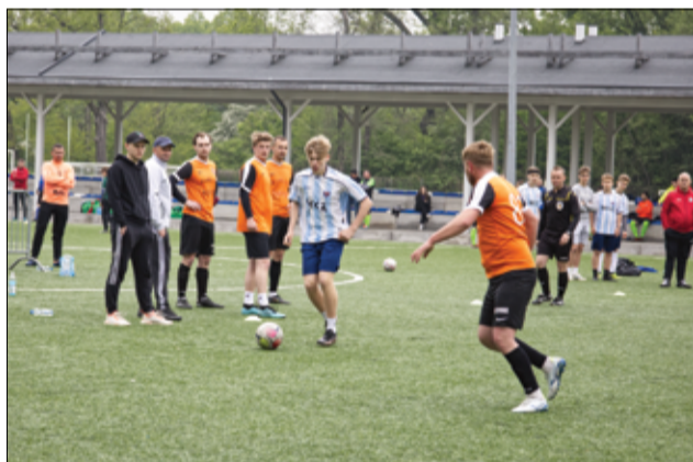
To były prawdziwe piłkarskie emocje do samego końca turnieju. Zawodnicy spisali się na medal.

- Gratuluję wszystkim uczestnikom turnieju, a przede wszystkim zwycięzcom. Dziękuję za tak liczny udział w drugiej już edycji turnieju Sudety Cup. To największy turniej organizowany w subregionie na Dolnym Śląsku. Mamy nadzieję jako zawodnicy i politycy, że będzie to impreza cykliczna i będziemy mogli każdego roku spotykać się, aby zagrać w piłkę nożną. Wielkie podziękowania również dla spon-