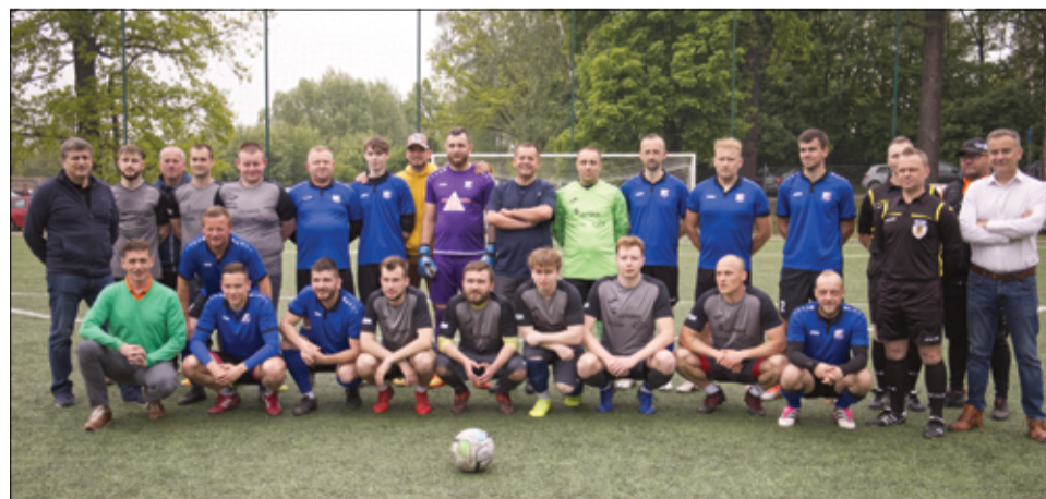
Zawodnicy Venus Nowice i LKS Tęcza Bolesławice wraz z organizatorami turnieju.

początek przy SP Żarów ul. 1 Maja 2 w Żarowie. Serdecznie zapraszamy. Informacja: Ośrodek Pomocy Społecznej w Żarowie