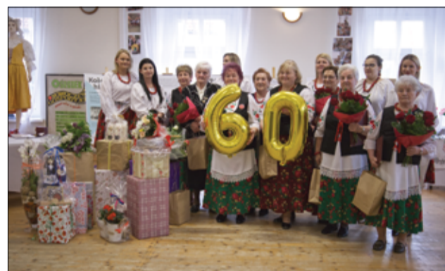
KGW Imbramowice to kobiety wyjątkowe, pełne energii, kreatywne, które dbają o przetrwanie tradycji naszego regionu.