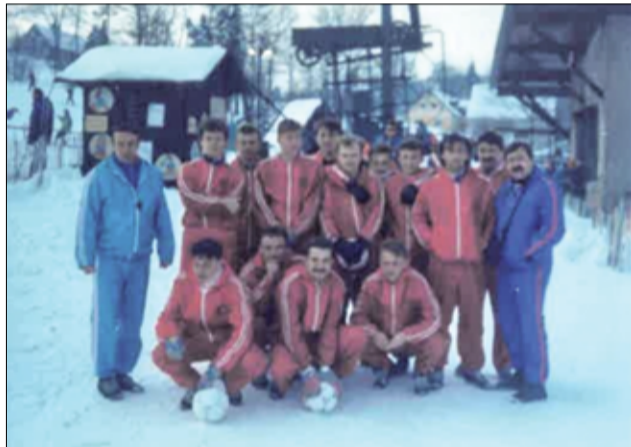
Obóz przygotowawczy po awansie do III ligi. Kouty nad Desnou (Czechy, 20-28.02.1993)

Klub Sportowy Zjednoczeni Żarów zaprasza wszystkich sympatyków piłki nożnej do wspólnego świętowania obchodów 30-lecia awansu do III ligi. Piknik i mecz towarzyski, gdzie zobaczymy głównych bohaterów tego najważniejszego momentu w historii żarowskiej piłki nożnej, odbędzie się 3 czerwca na Stadionie Miejskim w Żarowie. Początek o godz. 16:00.