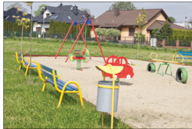
W tej chwili trwają prace przy budowie alejek.

– Kolejny plac zabaw na terenie naszego miasta zostanie przebudowany i doposażony w nowe oraz bezpieczne urządzenia zabawowe. Podpisaliśmy umowę na realizację zadania „Przebudowa infrastruktury rekreacyjnej przy ul. Wierzbowej w Żarowie” i niebawem teren ten zmieni swój wizerunek. Zakres inwestycji obejmuje dostawę i montaż zestawu zabawowego, urządzeń siłowni zewnętrznej, małej architektury (ławki, kosze na śmieci), tablicy z regulaminem, siłowni, tablicy informującej o historii miasta,