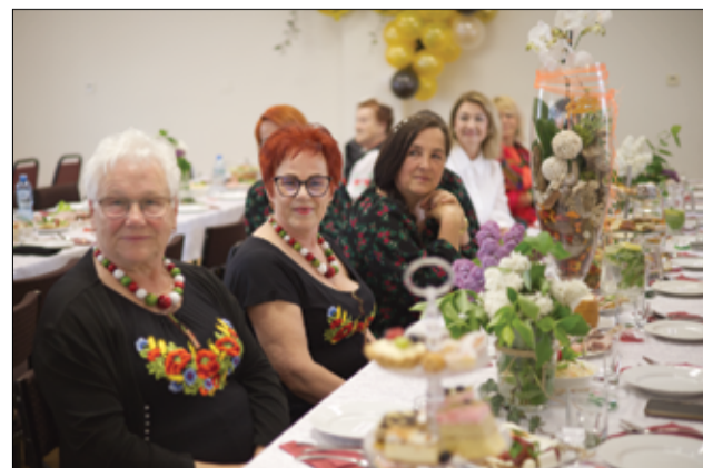
Wśród gości na jubileuszu KGW Imbramowice nie zabrakło przedstawicielek kół z terenu gminy Żarów.