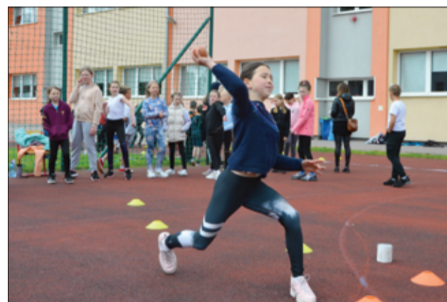
Dwubój lekkoatletyczny zgromadził ponad 100. dzieci z klas 1-4