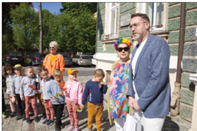
Pod UM Żarów na przedszkolaki czekał zastępca burmistrza Przemysław Sikora, który podziękował maluchom za wspianą wizytę.

- 10 maja wszystkie optymistyczne przedszkola świętują Ogólnopolskie Święto Optymizmu. Nasze przedszkole tradycyjnie włączyło się w obchody święta i zorganizowało przemarsz ulicami naszego miasta oraz wizytę u Pana Burmistrza w Urzędzie Miejskim w Żarowie. W tych czasach niczego tak bardzo nam nie potrzeba, jak właśnie optymizmu. Wiedzą o tym doskonale dzieci, które codziennie zarażają nas radością, pogodą ducha i to właśnie te cechy należy w nich