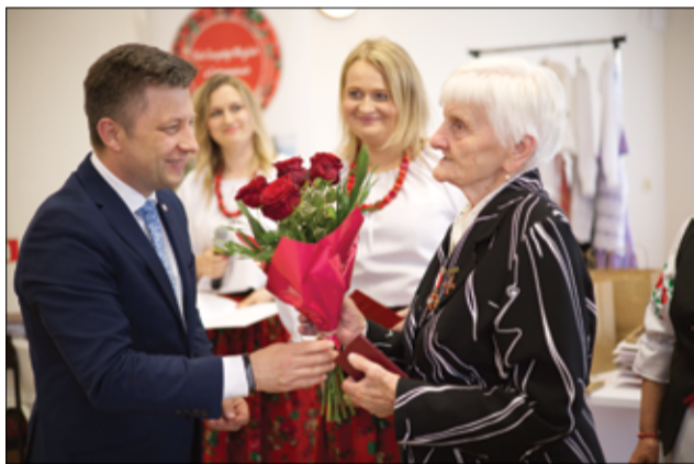
Odnaki „Zasłużony dla Kultury Polskiej” otrzymały najstarsze stażem Panie KGW Imbramowice, które w kole działają kolejno już od 60 i 50 lat. Odnaki wręczył minister Michał Dworczyk.

Koło Gospodyń Wiejskich z Imbramowic w sobotę, 13 maja świętowało jubileusz 60-lecia swojego funkcjonowania. Początkowo koło zajmowało się organizacją życia rolniczego na wsi. Następnie zajmowało się gotowaniem, szyciem, wyszywaniem. Panie organizowały wycieczki, pomagały potrzebującym, jak i organizowały różne warsztaty, kursy. To przyczyniło się do utworzenia „Praktycznej Pani” – miejsca spotkań dla mieszkańców. Działała w zespole ludowym Gromada. Dziś gospodynie z Imbramowic kontynuują prace swoich poprzedniczek. Biorą udział w licznych konkursach, akcjach charytatywnych, organizują wiele wydarzeń, pikników, wystaw, warsztatów. Wspólnie gotują, jeżdżą na wycieczki, przygotowują wieńce i biorą udział w dożynkach i wielu innych wydarzeniach w całej naszej gminie i na terenie powiatu świdnickiego. Obecnie koło liczy 21 członkiń, najstarsza gospodyni ma 92 lata, a najmłodsza niecałe 21 lat. Zapytane o to, czego im życzyć, zgodnie odpowiadają, że powiększenia swojej grupy i aby nie zaprzestać w swoich działaniach, mieć dużo siły, cierpliwości i przede wszystkim chęci.