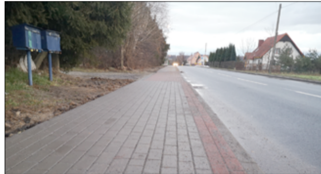
Kolejne odcinki chodników powstały w Kalnie, Łażanach, Bożanowie, Mrowinach, Imbramowicach oraz Bukowie.

w Imbramowicach (ul. Żarowska), Bukowie (od strony Bogdanowa), ► budowa chodników przy drogach gminnych na terenie gminy Żarów: Kalno, Łażany (ul. Sadowa), Bożanów (odcinek na zakręcie w stronę Żarowa), Mrowiny (ul. Wojska Polskiego),