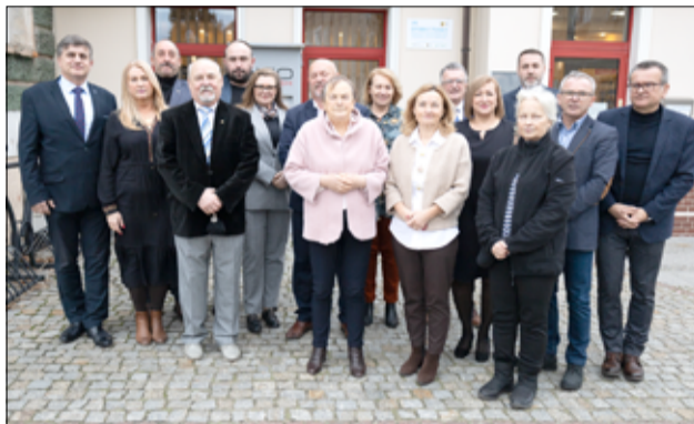
W trakcie posiedzenia radni pozytywnie zaopiniowali projekt nowego budżetu przygotowany przez Burmistrza i poparli go jednogłośnie.

Radzie Miejskiej za współpracę oraz zaangażowanie w procesie tworzenia budżetu. Jesteśmy przekonani, że przyjęte założenia finansowe będą sprzyjały zaplanowanym inwestycjom – mówili burmistrz Leszek Michalak i zastępca burmistrza Przemysław Sikora.