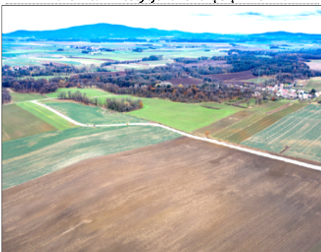
Pozyskana przez gminę Żarów dotacja pozwoli na realizację kolejnego etapu prac przy budowie obwodnicy Pożarzyska.