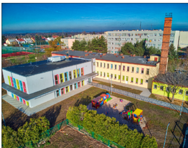
Rok 2024 przyniesie nam kolejną inwestycję oświatową. Będzie to rozbudowa Przedszkola Miejskiego w Żarowie.