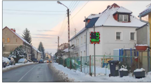
W Łażanach został zainstalowany radarowy wyświetlacz prędkości. Urządzenie ma sprzyjać poprawie bezpieczeństwa kierowców, rowerzystów oraz pieszych.