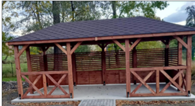
W ramach zadań z funduszu sołectkiego mieszkańcy Mrowin przeznaczali środki finansowe na zagospodarowanie centrum wsi. Została zainstalowana tutaj wiatka spotkań.