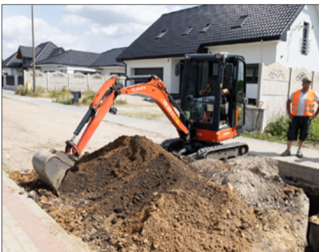
W 2023r. rozpoczęliśmy prace przy budowie dróg na ul. Cembrowskiego, Stumetrówki i ks. Jadwigi w Żarowie. Inwestycje zakończą się w 2024r.