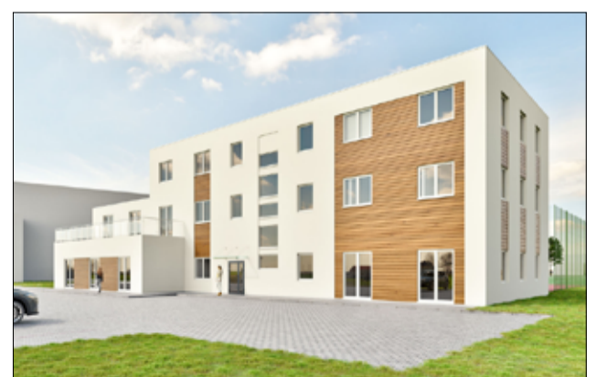
Wizualizacja nowego obiektu sportowego, który powstanie na terenie naszego miasta. Będzie tutaj siłownia wraz z zapleczem noclegowym.