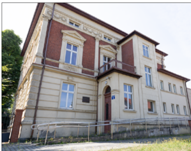
Zabytkowa Willa Treutler-Schlosser już niebawem doczeka się gruntownego remontu.