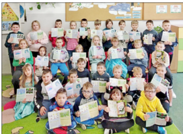
Na zdjęciu najmłodsi uczniowie z SP Żarów z profilaktycznym kalendarzem ucznia.

Kalendarz rozpowszechniony zostanie wśród blisko 560 uczniów z klas 0 – III. W Kalendarzu zostały zamieszczone rysunki o tematyce profilaktycznej, wykonane przez uczniów z żarowskich szkół i przedszkola. Każdy miesiąc opatrzony jest innym hasłem profilaktycznym np. maj „Słowa mają moc. Zatrzymaj się kolego, powiedz komuś coś miłego!”, grudzień „Dbaj o kontakty z innymi. Nie siedź wciąż przed komputerem, do kolegi jedź rowerem!”. Osoby, których prace zostały zawarte w Kalendarzu Ucznia,