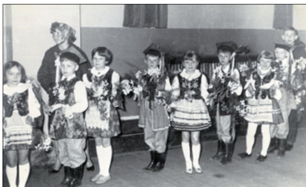
Uczniowie Szkoły Podstawowej w latach 60-tych, którzy przygotowywali się na udział w pochodach.

ponieważ źle to mogło wpłynąć na dzieci i młodzież. Klasy liczyły wówczas 40 dzieci, a sam etat wynosił 60 godzin. Praca w szkole odbywała się na dwie zmiany, zajęcia lekcyjne trwały w godz. 8.00 – 17.00. W tamtych czasach, latach 60-tych, nie było dyrektorów szkół. Rolę dyrektora pełnili kierownicy szkół. Nauczanie początkowe było realizowane w klasach I – IV.