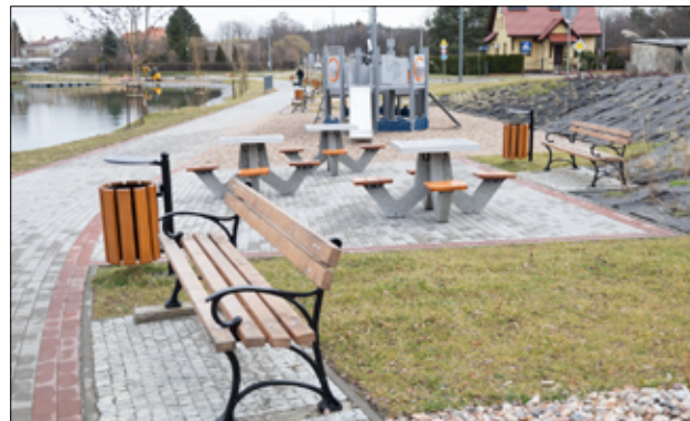
W ostatnim czasie nad stawem miejskim w Żarowie postawione zostały nowe leżaki i stoliki do gry w szachy.

– Zrewitalizowany staw to kolejna zielona przestrzeń w naszym mieście. Miejsce wypoczynku i strefa relaksu. Dobiegają końca prace przy realizacji tej inwestycji, przed nami jeszcze montaż elementów