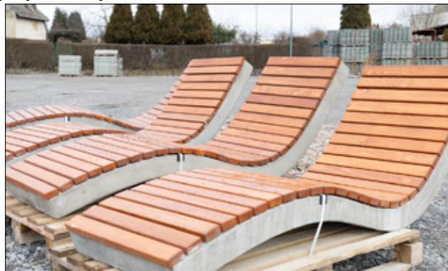
Na terenie stawu w Żarowie powstaje mała strefa relaksu. To już ostatni etap prac, które realizujemy w tym miejscu.

Były to inwestycje, na które pozyskaliśmy 4,5 mln zł dofinansowania z Rządowego Programu Fundusz Polski Ład. Staw po rewitalizacji zmienił swój wygląd. Nowe ławki, alejki, oświetlenie, a nawet zagospodarowane miejsce do zabawy dla naszych najmłodszych mieszkańców, pływający pomost i liczne nasadzenia wpłynęły na poprawę estetyki tego miejsca. W ostatnim czasie na terenie stawu przy ul. Wyspiańskiego w Żarowie ustawione zostały nowe elementy, które tworzyć będą strefę wypoczynku dla odwiedzających to miejsce. Pojawiły się nowe leżaki oraz plenerowe stoliki do gry w szachy. To jeszcze nie koniec wszystkich atrakcji, bowiem niebawem zainstalowana zostanie także pływająca fontanna.