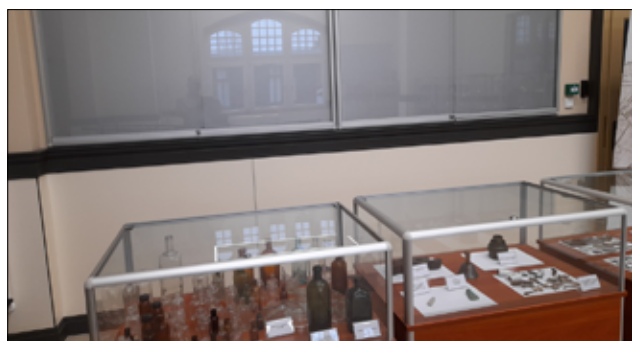
W oparciu o nowy sprzęt ekspozycyjny, Żarowska Izba Historyczna zaprasza na nowe wystawy.

7 lutego 2024r. w Żarowskiej Izbie Historycznej odbył się montaż 8 nowych gablot ściennych, które w znacznym zakresie poszerzą jej możliwości ekspozycyjne.