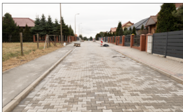
Drogi przy ul. Cembrowskiego oraz Stumetrówki w Żarowie również doczekały się remontu. Trwają tutaj jeszcze ostatnie prace wykończeniowe.

– Są to drogi, które wymagają pilnej modernizacji, dlatego zależy nam, aby zostały wyremontowane i w dobrym stanie oddane do użytku naszym mieszkańcom. W Żarowie ulice zyskają nowe nawierzchnie asfaltowe oraz chodniki, natomiast w Łazanach powstaną drogi asfaltowe z kanalizacją deszczową oraz oświetleniem. Wszystkie powyższe inwestycje są dofinansowane w ramach programów rządowych – mówi zastępca burmistrza Przemysław Sikora.