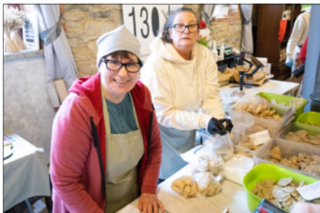
Producenci zdrowej żywności serwowali uczestnikom targu także pyszne, swojskie pierogi.

jemy wszystkim odwiedzającym zdrowe produkty i chyba to jest najważniejsze.