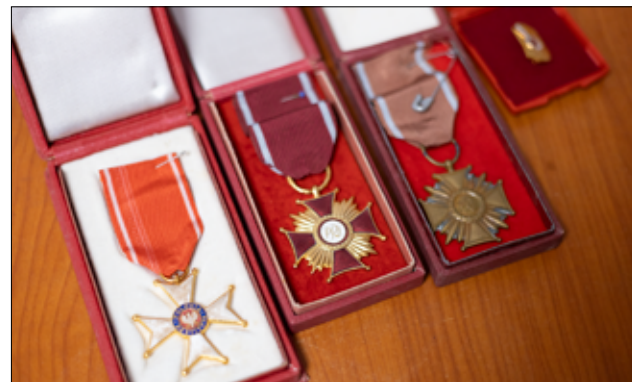
Takie odznaczenia za zasługi na rzecz oświaty otrzymywali w podziękowaniu za pracę nauczyciele.

– Oczywiście, że pamiętam... Bardzo często wspólnie z dziećmi chodziliśmy do kina w Żarowskim Ośrodku Kultury, ale zawsze w asyście wówczas milicjantów. Po godz. 20.00 dzieciom nie wolno było samemu wychodzić. Często uczniowie dojeżdżali do szkół pociągami,