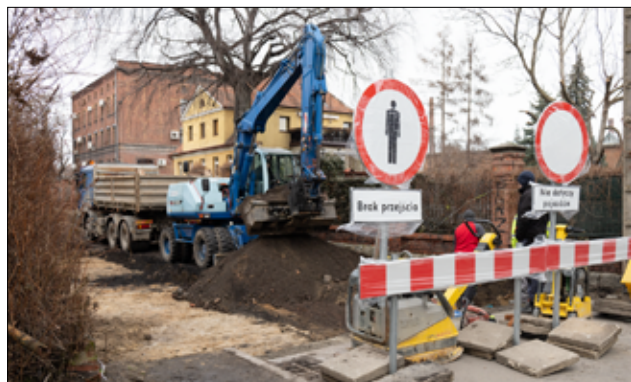
Na tę inwestycję mieszkańcy ul. Hutniczej czekali od dawna. Zniszczona nawierzchnia drogowa doczeka się kompleksowej przebudowy.

Jest to już kolejna droga w tej części naszego miasta, która doczeka się gruntownej modernizacji. Inwestycja realizowana jest w ramach zadania inwestycyjnego „Przebudowa i remonty dróg gminnych na terenie miasta i gminy Żarów”. Niebawem ruszą również prace przy przebudowie drogi na ul. Słowiańskiej w kierunku Kalna oraz Polnej i Szkolnej w Łazanach. Na realizację remontu dróg gmina Żarów pozyskała dofinansowanie z Rządowego Funduszu Rozwoju Dróg.