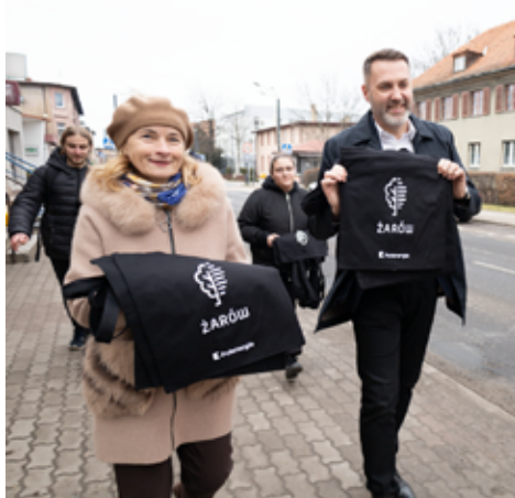
Cieszymy się, że mieszkańcy tak chętnie włączyli się do naszej akcji i mamy nadzieję, że torby będą im służyły do codziennych zakupów.

Torby zostały zakupione dzięki wsparciu finansowemu z firmy Polenergia, za co serdecznie dziękujemy. Akcja cieszyła się dużym zainteresowaniem wśród mieszkańców