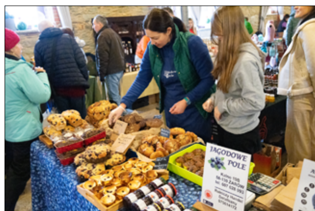
Na stoisku producenta Jagodowe Pole nie zabrakło pyszności, w których główną rolę odgrywały borówki amerykańskie.

lokalnych twórców. Wśród nich soki, octy, powidła, miody, sery, pieczywo, syropy. Poza tym wyroby rękodzielnicze, biżuteria czy pachnące świece. Każdy mógł znaleźć coś dla siebie.